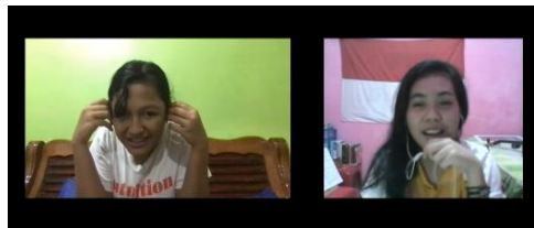
Gambar 5. Wawancara Virtual dengan Remaja 4

Remaja 4 (R) menerangkan bahwa berbagai jenis musik sering diputar atau diperdengarkan di rumahnya. Contoh musik populer direspon dengan sangat baik. Baginya lagu-lagu yang tersebut tidaklah asing lagi. Disamping itu, ia memiliki kakak yang berprofesi sebagai penyanyi komersial. Ini membuatnya mendengar musik pop. Perihal musik klasik, ia cukup menikmati musik yang diberikan. Namun demikian, ia tidak mengenali satupun tokoh musik klasik yang diberikan. Selain nyaman didengar, musik populer dipilih karena beat atau hentakan lagu-lagu pop memberi dorongan untuk menari. Namun ia tidak mengatakan bahwa musik klasik itu tidak enak didengar. Menurutnya, musik klasik adalah jenis musik yang unik tapi tidak untuk dinikmati saat santai karena musiknya yang cenderung membuat banyak orang merasa bosan dan 'ngantuk'.