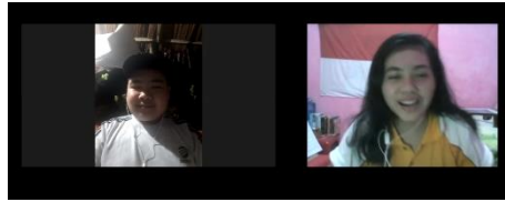
Gambar 4. Wawancara Virtual dengan Remaja 3

Remaja 4 (R) menerangkan bahwa berbagai jenis musik sering diputar atau diperdengarkan di rumahnya. Contoh musik populer direspon dengan sangat baik. Baginya lagu-lagu yang tersebut tidaklah asing lagi. Disamping itu, ia memiliki kakak yang berprofesi sebagai penyanyi komersial. Ini membuatnya mendengar musik pop. Perihal musik klasik, ia cukup menikmati musik yang diberikan. Namun demikian, ia tidak mengenali satupun tokoh musik klasik yang diberikan. Selain nyaman didengar, musik populer dipilih karena beat atau hentakan lagu-lagu pop memberi dorongan untuk menari. Namun ia tidak mengatakan bahwa musik klasik itu tidak enak didengar. Menurutnya, musik klasik adalah jenis musik yang unik tapi tidak untuk dinikmati saat santai karena musiknya yang cenderung membuat banyak orang merasa bosan dan 'ngantuk'.