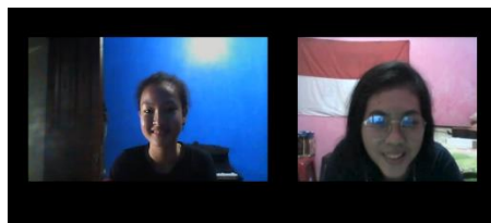
Gambar 3. Wawancara Virtual dengan Remaja 2

Remaja 2 (D) memiliki wawasan yang lebih luas terhadap kedua jenis musik tersebut. Selain mengenal tokoh- tokoh musik populer, remaja ini juga mengetahui tokoh-tokoh musik klasik. Eine Kleine Nachtmusik dan Clair de Lune juga dikenali dan pernah didengarkan. Menurutnya, pengetahuan tentang musik klasik diperoleh dari saudara kandung yang sedang menempuh studi musik di perguruan tinggi. Namun demikian, ia kurang menyukai karena dianggap kurang asik. Baginya, musik klasik itu 'ga seru'. Mendengar musik klasik membuatnya mengantuk sehingga kurang menyenangkan apabila dibandingkan dengan musik pop yang membangkitkan semangatnya saat beraktivitas dan bersantai.