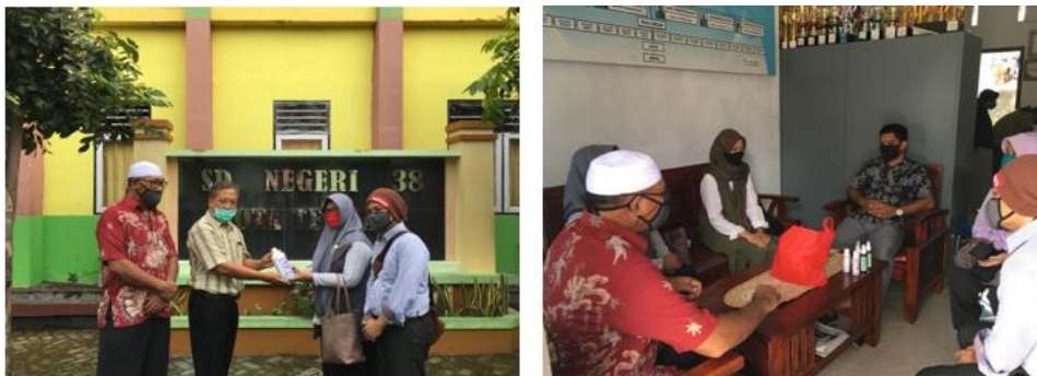
Gambar 6. Penyebaran produk dan edukasi hidup sehat di salah satu SD di kota ternate

Setelah produksi selesai, didapatkan hasil produksi sejumlah 300 botol hand sanitizer . Kemudian produk ini didistribusikan ke 6 (enam) lokasi di kota ternate, yaitu di fakultas FKIP, Pasca sarjana, LPPM, Fakutas Sastra, Fakultas Perikanan, dan sekolah PAUD, TK, SD, SMP dan SMA di kota Ternate. Selain mendistribusikan produk hand sanitizer , dilakukan juga edukasi tentang pola hidup sehat di lokasi-lokasi tempat penyebaran produk.