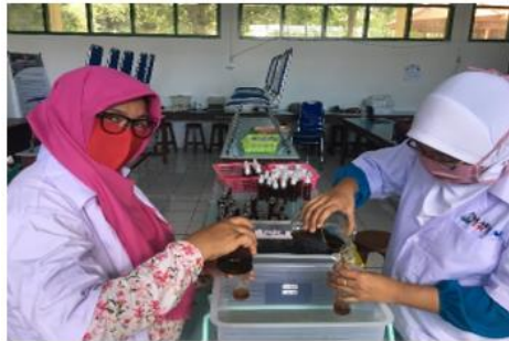
Gambar 3. Pencampuran semua bahan

kayu sabo yang mengandung vit. E, dengan komposisi 600ml alkohol, 400 ml ekstrak tangkai bunga cengkeh, 20 ml gliserin dan 10gram kayu sabo.