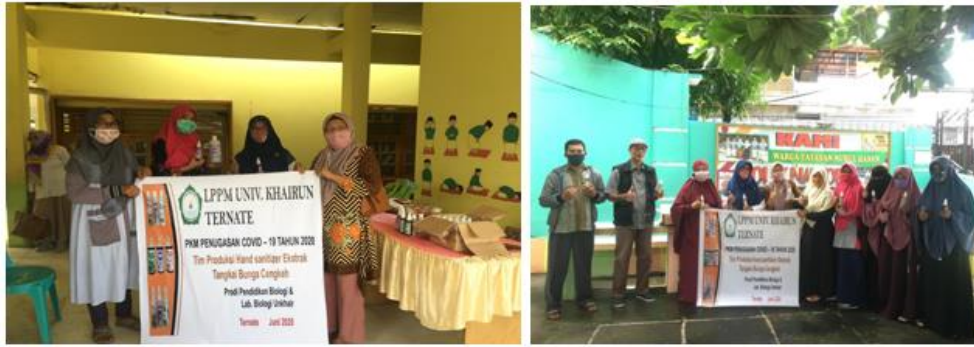
Gambar 7. Penyerahan Produk Hand sanitizer di Sekolah TK dan PAUD

Tahap selanjutnya yaitu evaluasi pengembangan produk hand sanitizer berbahan dasar ekstrak tangkai bunga cengkeh. Evaluasi dilakukan dengan cara uji tingkat penerimaan produk (Fikriawan, 2019). Berdasarkan hasil analisis tingkat hasil penerimaan masyarakat di kota Ternate terhadap produk hand sanitizer berbahan baku ekstrak tangkai bunga cengkeh diperoleh persentase sebesar: