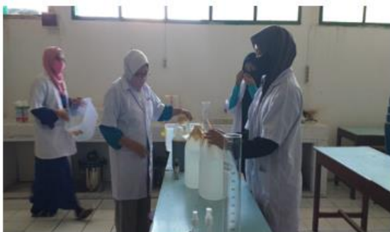
Gambar 1. Dosen mendampingi mahasiswa membuat ekstrak tangkai bunga cengkeh

Pada tahap persiapan dosen dan mahasiswa mempersiapkan bahan-bahan untuk pembuatan hand sanitizer . Antara lain alkoho 70%, gliserin dan ekstrak tangkai bunga cengkeh. Sebelum pencampuran dilakukan, dosen terlebih dahulu mendampingi mahasiswa dalam pembuatan ekstrak tangkai bunga cengkeh. Dosen mengarahkan dan memberi petunjuk mengenai takaran bahan-bahan yang digunakan.