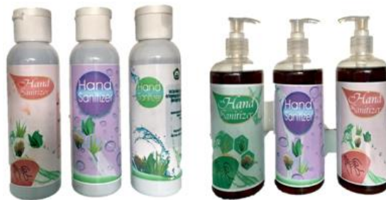
Gambar 5. Produk akhir hand sanitizer ekstrak tangkai bunga cengkeh

Setelah produksi selesai, didapatkan hasil produksi sejumlah 300 botol hand sanitizer . Kemudian produk ini didistribusikan ke 6 (enam) lokasi di kota ternate, yaitu di fakultas FKIP, Pasca sarjana, LPPM, Fakutas Sastra, Fakultas Perikanan, dan sekolah PAUD, TK, SD, SMP dan SMA di kota Ternate. Selain mendistribusikan produk hand sanitizer , dilakukan juga edukasi tentang pola hidup sehat di lokasi-lokasi tempat penyebaran produk.