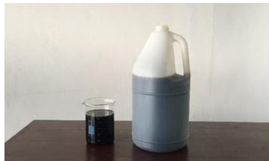
Gambar 2. Hasil pengekstrakan tangkai bunga cengkeh

Setelah hasil pengekstrakan tangkai bunga cengkeh didapatkan, kemudian dilakukan pencampuran antara ekstrak tangkai bunga cengkeh dengan alkohol 70%, gliserin, dan maserasi