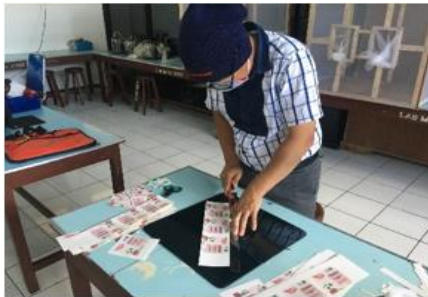
Gambar 4. Persiapan Labeling

Setelah hasil pencampuran didapatkan selanjutnya ke tahap pengemasan dan labeling produk.