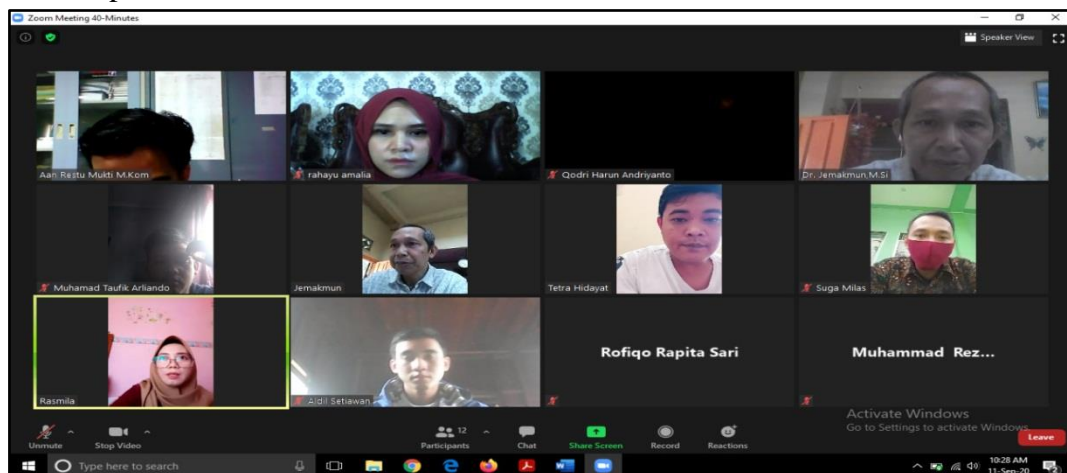
Gambar 2. Proses Pembukaan Pelatihan secara online

Berikut ini beberapa dokumentasi saat pelaksanaan Pelatihan Online tentang internet sehat terhadap Siswa - Siswi SMK Nurul Huda Pemulutan Barat :