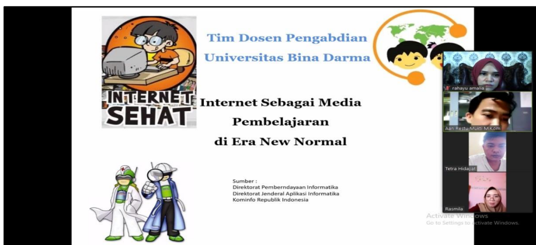
Gambar 3. Pemaparan Materi 1