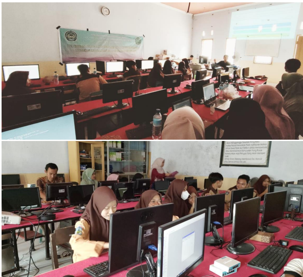
Gambar 5. Pelatihan Desain Grafis dan Multimedia untuk Siswa