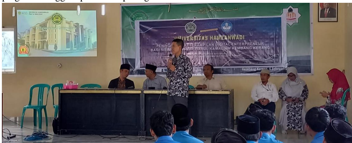
Gambar 3. Mengawali kegiatan pelatihan dengan sosialisasi perguruan tinggi.

Pada kegiatan ini dilakukan Digital Entrepreneur kepada Guru dan juga siswa siswi SMK NW Kembang Kerang untuk kelas XI dan XII, kegiatan pelatihan berlangsung dengan baik yang dimulai dari pengenalan program studi secara khusus dan universitas secara umum kepada siswa siswi, hal ini bertujuan untuk menjalin komunikasi yang baik di awal dengan para siswa siswi, terlebih pelatihan yang akan diberikan adalah pelatihan tentang kompetensi keahlian siswa, sehingga dengan sosialisasi tersebut siswa mengetahui kompetensi dari pada narasumber yang akan memaparkan materi terkait dengan desain grafis dan animasi multimedia. Adapun kegiatan sosialisasi terkait dengan identitas perguruan tinggi dapat dilihat pada gambar 3 di bawah ini :