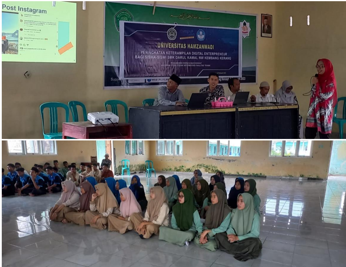
Gambar 4. Pemaparan materi terkait Digital Entrepreneur pada siswa

Adapun kegiatan sosialisasi digital Entrepreneur dari tim sebelum dilaksanakan pelatihan inti terkait dengan kompetensi siswa dalam bidang Desain Grafis dan Animasi multimedia, dapat dilihat pada gambar 4 di bawah ini.