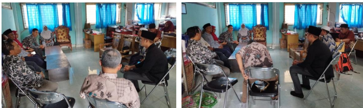
Gambar 2. Sosialisasi Kepada Pihak Sekolah