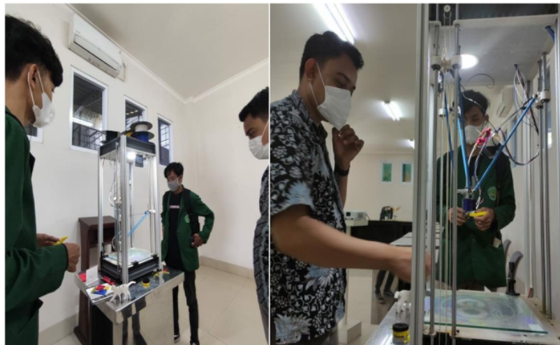
Gambar 4. Pengembangan Produk Inovasi

Pada gambar 3, tim mahasiswa dengan dosen dan tim STIPARK melakukan rapat koordinasi terkait produk inovasi yang akan diimplementasikan pada kegiatan magang industri.