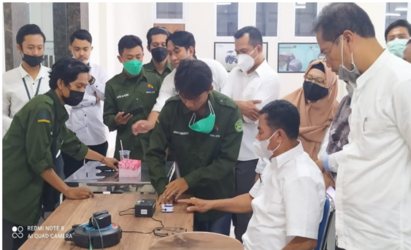
Gambar 8. Tahap uji coba sekaligus pengenalan produk kepada mitra