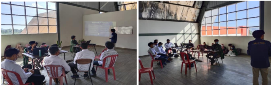
Gambar 2. Sosialisasi Presentasi Produk Inovasi

Pada tahap ini sesuai gambar 2, tim mahasiswa melakukan sosialisasi terhadap hasil penelitian yang akan di implementasikan dalam kegiatan magang ini melihat dari permasalahan yang sedang terjadi di kalangan masyarakat maupun medis yaitu terkait tentang beberapa kasus pasien isolasi mandiri yang meninggal. Sehingga diperlukan sebuah produk yang nantinya diharapkan bisa bermanfaat buat masyarakat maupun mitra.