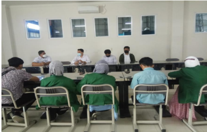
Gambar 3. Rapat koordinasi TIM STIPARK NTB

Pada gambar 3, tim mahasiswa dengan dosen dan tim STIPARK melakukan rapat koordinasi terkait produk inovasi yang akan diimplementasikan pada kegiatan magang industri.