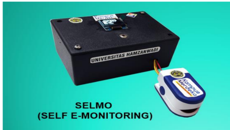
Gambar 5. Tampilan Alat Box SELMO

halaman utama yang terdapat informasi mengenai data kondisi pasien baik data suhu ruangan, suhu tubuh, data kadar oksigen (SP02) dan denyut jantung (BPM) (Sofiani dkk., 2021).