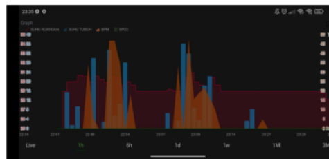
Gambar 6. Tampilan Aplikasi Monitoring Berbasis Android