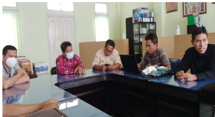
Gambar 2. Rapat Persiapan Kegiatan

Kegiatan lokakarya ini terdiri dari tiga sesi pelatihan di mana para pesertanya merupakan pelaku UMKM di tiga kecamatan di Kabupaten Lombok Timur. Sebelum kegiatan dilaksanakan terlebih dahulu diadakan rapat-rapat koordinasi sesama tim dosen dan pemateri beserta koordinator program studi Teknik Informatika Fakultas Teknik seperti yang terlihat pada gambar 2.