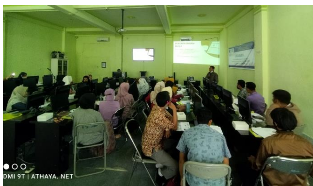
Gambar 5. Penyampaian Materi Manajemen Keuangan

Pada hari ke 2 dan 3 peserta yang hadir sebanyak 35 orang dengan peserta yang berbeda, sementara materi pelatihan yang didapat sama dengan narasumber yang sama juga, sehingga jumlah peserta yang ditargetkan terpenuhi 100 orang. Peserta terlihat sangat antusias sekali mengikuti kegiatan pelatihan ini, terlebih para peserta baru memahami pentingnya pemanfaatan teknologi informasi dalam mengembangkan usaha maupun produk UMKM. Salah satunya materi pemanfaatan media sosial dalam memasarkan hasil produknya dan materi teknologi informasi, materi yang diajarkan adalah mengenai strategi digital marketing untuk meningkatkan perkembangan usaha dari pelaku UMKM. Pada saat pemberian pelatihan tidak hanya cerita tentang teori tetapi lebih terhadap pembahasan masalah yang mereka hadapi selama ini. Untuk bidang keuangan, kewirausahaan, ruang pelatihan dibagi menjadi untuk para pelaku usaha yang memproduksi barang, jasa, serta berdagang atau berjualan. Mereka dapat membahas masalah-masalah yang mereka hadapi selama ini.