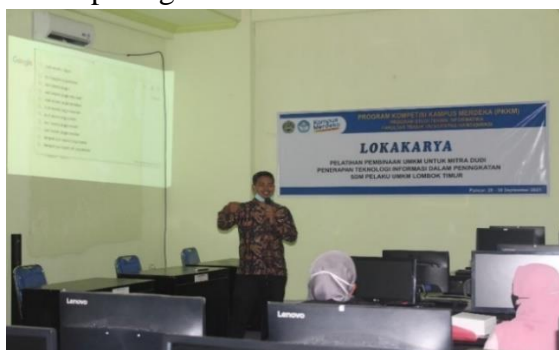
Gambar 3. Penyampaian Materi Teknologi Informasi

Pada pelatihan hari pertama dihadiri oleh 30 peserta UMKM, pada hari pertama peserta pelaku UMKM diberikan pelatihan bidang keuangan, pemasaran (E-Commerce) dan teknologi informasi. Untuk kegiatan ini pelatihan Teknologi Informasi, seperti yang terlihat pada gambar 3. Untuk pelatihan pemasaran ( E-Commerce ) seperti terlihat pada gambar 4. dan untuk Manajemen Keuangan diberikan oleh dosen yang memang ahli pada bidangnya. seperti yang terlihat pada gambar 5.