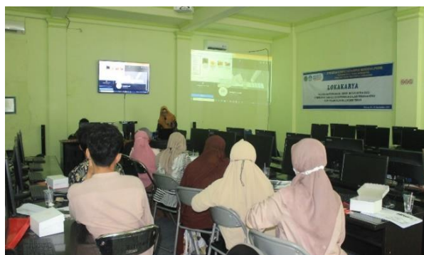
Gambar 4. Penyampaian Materi Strategi Pemasaran (E-Commerce)