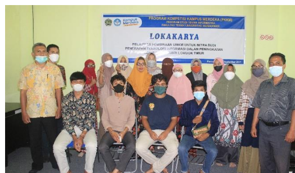
Gambar 7. Foto Bersama Panitia dengan peserta pelatihan UMKM