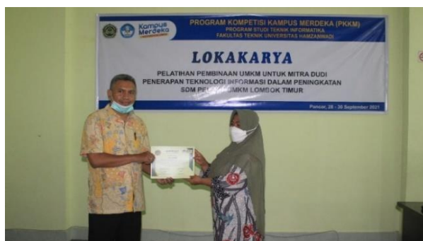
Gambar 6. Penyerahan Sertifikat Pelatihan UMKM ke Peserta

Ternyata masalah yang paling banyak memang masalah pada bidang keuangan, baik itu pada pengelolaannya yang masih tercampur akan pengelolaan keuangan keluarga serta keuangan usaha, kurangnya modal, sulitnya mendapatkan jejaring dengan pihak lembaga keuangan atau perbankan. Untuk bidang pemasaran masalah yang mereka hadapi adalah masalah dari sulitnya mendapatkan tempat untuk berjualan, sulitnya memperluas pasar, ketidaktahuan untuk melakukan alat promosi dan pentingnya pengembangan produk. Selain dari itu pada bidang teknologi informasi adalah sulitnya untuk menentukan strategi digital marketing untuk mendapatkan supplier atau pemasok yang lokasinya dekat dengan tempat mereka berusaha serta sulitnya mendapatkan barang. peserta ternyata banyak juga yang belum memaksimalkan media sosial dalam memasarkan produknya. Di setiap sesi kegiatan tim kemudian mengajukan pertanyaan bagaimana kesan peserta setelah mengikuti kegiatan ini. Dari jawaban peserta setelah mengikuti pelatihan ini sangat membantu mereka sebagai pelaku usaha untuk mengembangkan teknik pemasaran dengan memanfaatkan teknologi informasi. Setelah kegiatan selesai tim memberikan sertifikat mengikuti kegiatan pelatihan pendampingan UMKM secara simbolis seperti yang terlihat pada gambar 6 dan di lanjutkan dengan foto Bersama tentunya dengan mematuhi standar protokol kesehatan Covid-19.