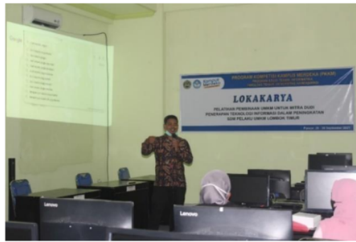
Gambar 3. Penyampaian Materi Teknologi Informasi