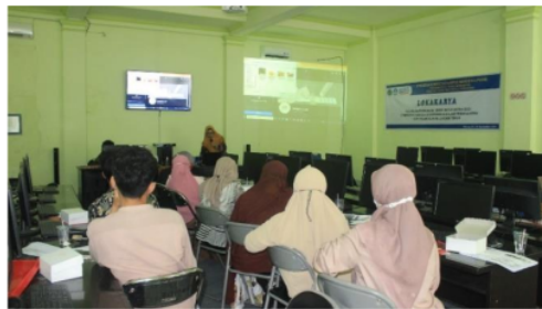
Gambar 4. Penyampaian Materi Strategi Pemasaran (E-Commerce)