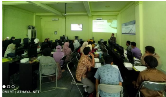
Gambar 5. Penyampaian Materi Manajemen Keuangan