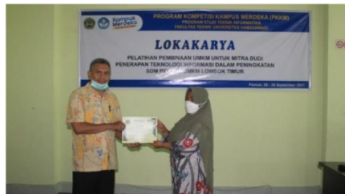
Gambar 6. Penyerahan Sertifikat Pelatihan UMKM ke Peserta