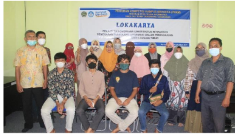
Gambar 7. Foto Bersama Panitia dengan peserta pelatihan UMKM