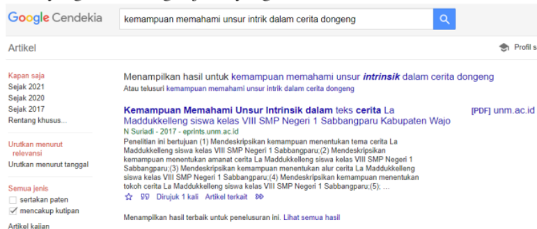
Gambar 4. Cara pencarian referensi melalui Google Scholar/Cendekia

Kesulitan lain adalah pencarian referensi yang akurat yang dapat dijadikan bahan untuk pembahasan sehingga para guru diajarkan cara mencari referensi yang sesuai dengan judul yang dibahas yaitu menggunakan Google Scholar (Gambar 4). Di sisi lain, para guru juga diminta memperhatikan jurnal-jurnal yang terdapat pada Google Scholar untuk dijadikan target publikasi yang sesuai dengan judul yang diteliti.