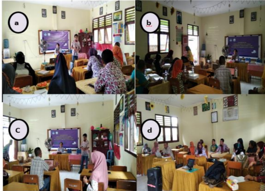
Gambar 2. Dokumentasi PKM tentang penulisan laporan ilmiah PTK

Pada tahap pendampingan penulisan karya ilmiah dilakukan dengan cara berkelompok. Hal ini disebabkan ketersediaan fasilitas komputer oleh mitra yang tidak mencukupi. Terdapat 3 laptop sehingga guru-guru dibagi dalam 3 kelompok (Gambar 2d). setiap kelompok diberikan kebebasan dalam menentukan permasalahan yang akan diangkat. Pada tahap ini, tiap kelompok diminta untuk menyusun latar belakang dan metode penelitian berdasarkan prosedur PTK. Hasil penulisan awal langsung dilakukan evaluasi.