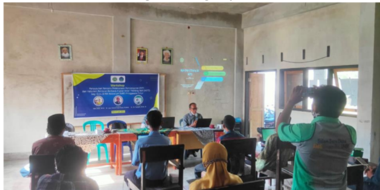
Gambar 3. Pemateri 2 Sedang Menyampaikan Materi tentang Pengembangan Perangkat Pembelajaran (RPP) yang berorientasi HOTS