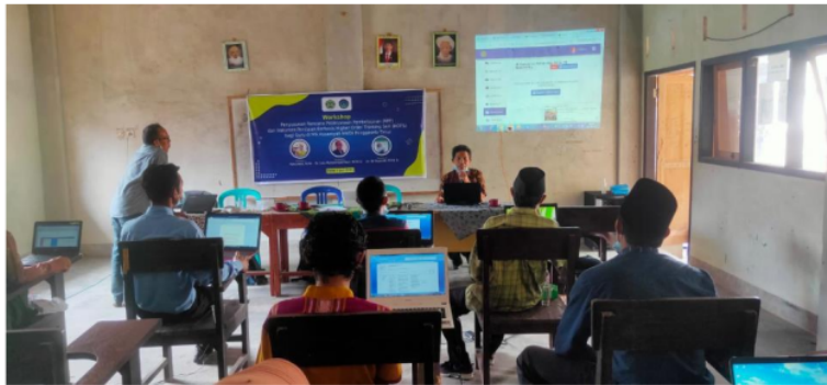
Gambar 5: Salah Satu Guru Sedang Presentasi Hasil Diskusi

Sebagai evaluasi kegiatan, peserta diberikan angket respons terhadap proses workshop yang telah dilakukan. Dari data angket terhadap 17 peserta kemudian di analisis satu persatu peserta dan masing-masing item instrumen. Analisis data. Hasil analisis data terhadap data angket yang telah terkumpul sebagai berikut 1) sebanyak 84% peserta memberikan respons bahwa istilah Higher Order Thinking Skills (HOTS) merupakan hal yang baru mereka dengar, 2) 87% peserta menyatakan belum pernah menyusun perangkat dan instrumen Higher Order Thinking Skills (HOTS) , 3) 100% peserta menyatakan kegiatan workshop ini adalah kegiatan yang sangat bermanfaat bagi guru, 4) 90% peserta memberikan respons materi yang diberikan menyenangkan bagi peserta, dan sebanyak 95% peserta memberikan respons Kegiatan pelatihan perlu tindak lanjut.