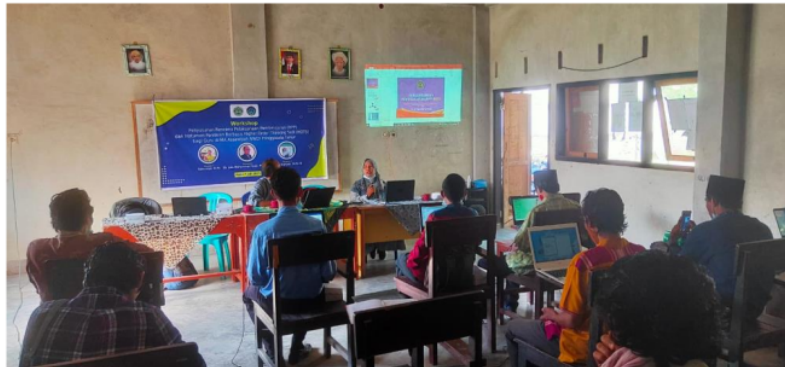
Gambar 2. Pemateri 1 Sedang Menyampaikan Materi tentang Konsep dasar HOTS dan perkembangannya