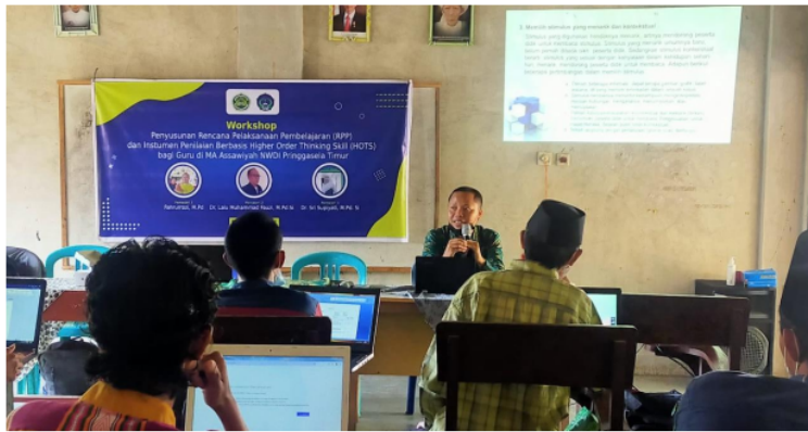
Gambar 4: Pemateri 3 Sedang Menyampaikan Materi Tentang Penyusunan instrumen HOTS