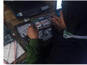
Gambar 6. Laptop Acer Es1- 211