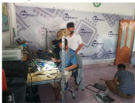
Gambar 7. Proses pengenalan Blok Mainboard Laptop

Pada tahapan ini peserta diberikan materi membuka dan memasang komponen laptop pada Acer D270 (ZE6).