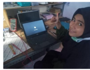
Gambar 12. Proses Instalasi Selesai