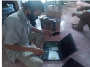
Gambar 5. Laptop Asus X453M