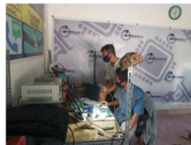
Gambar 8. Proses pengenalan Blower (alat pengangkat IC)