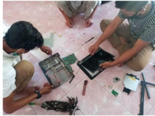
Gambar 4 . Laptop Asus X453M

Pada sesi ini peserta diberikan praktek pada laptop Asus X453M dan Acer es1-211. Adapun hal-hal yang harus diperhatikan saat bongkar adalah tahapan membuka dari casing, Mainboard dan LCD nya.