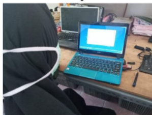
Gambar 11. Proses Instalasi (Bootable)

Pada tahapan ini materi yang diberikan adalah instalasi Windows 7 pada laptop Acer D270 dengan dimulai dari pembuatan FD Bootable .