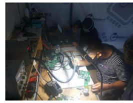
Gambar 9. Proses belajar membuka komponen.