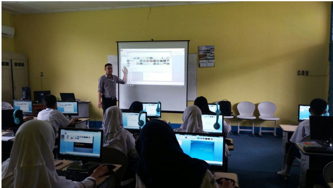
Gambar 5. Pemberian arahan pemaparan bahan presentasi