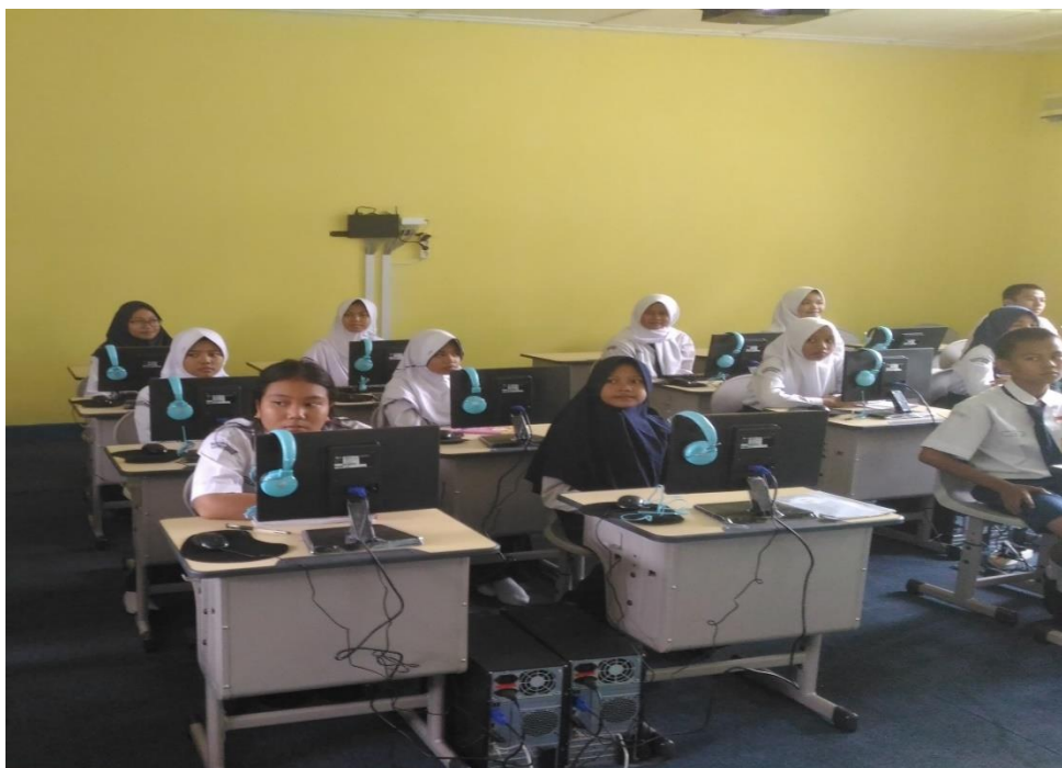
Gambar 4. Pelaksanaan pelatihan hari pertama di Laboratorium Komputer

Pada hari kedua pelaksanaan kegiatan pelatihan, setiap peserta siswa telah mempersiapkan bahan presentasi yang mereka buat pada hari pertama. Diawali dengan pengarahan Tim Dosen untuk tata cara presentasi yang baik dan benar, beberapa peserta siswa dengan bahan presentasi yang menarik akan memaparkan bahan presentasinya di depan peserta lainnya. Berikut ini dokumentasi kegiatan pada hari kedua di SMP Patra Mandiri 2 Palembang.