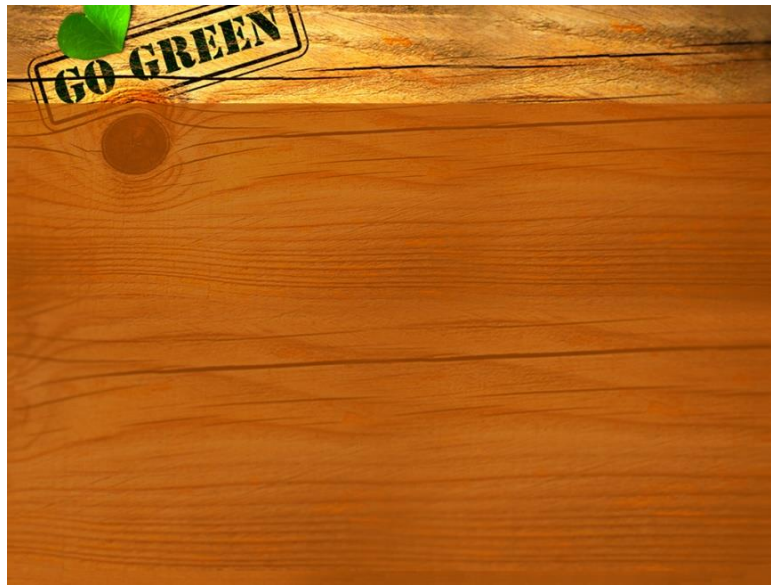
Gambar 1. Contoh Background Power Point

mengganti background atau bisa juga dengan mengganti template power point (Badri & Riasti, 2017). Berikut ini salah satu contoh background presentasi yang dapat digunakan.