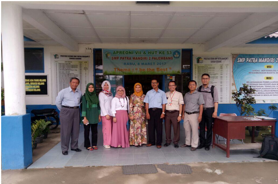
Gambar 3. Pembukaan kegiatan pelatihan bersama Guru SMP Patra Mandiri 2 Palembang