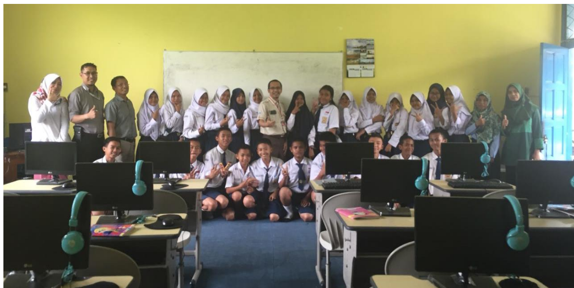
Gambar 6. Penutupan kegiatan pelatihan di SMP Patra Mandiri 2 Palembang