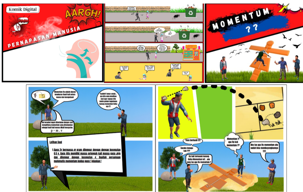
Gambar 4. Contoh Produk Media Komik Digital