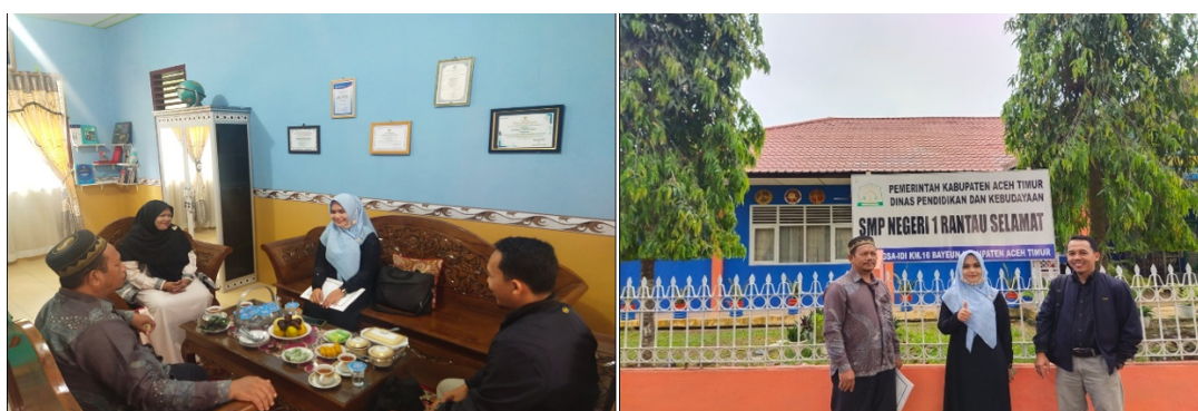
Gambar 2. Observasi Awal tim dan FGD dengan Kepala Sekolah SMPN 1 Rantau Selamat

Sosialisasi pelatihan media digital dilaksanakan sebelum dimulainya pelatihan pembuatan media. Pelatihan ini diikuti oleh peserta guru-guru setiap mata pelajaran dan dihadiri Kepala Sekolah dan Wakil bidang Kurikulum SMPN 1 Rantau Selamat. Kegiatan dilaksanakan dengan sangat kondusif dan lancar. Pada acara sosialisasi program dilaksanakan secara diskusi terbuka antara tim PKM dengan guru sebagai mitra. Selama diskusi berlangsung saling bertukar informasi terhadap media-media digital yang pernah digunakan. Adapun target dari kegiatan PKM ini disampaikan secara langsung oleh tim, bahwa setelah mengikuti kegiatan setiap guru harus memiliki 1 produk media digital yang nantinya dapat diterapkan pada saat semester Ganjil Tahun Pelajaran 2022/2023. Produk media digital boleh dipilih sesuai dengan kesesuaian mata pelajaran yang diampu oleh guru.