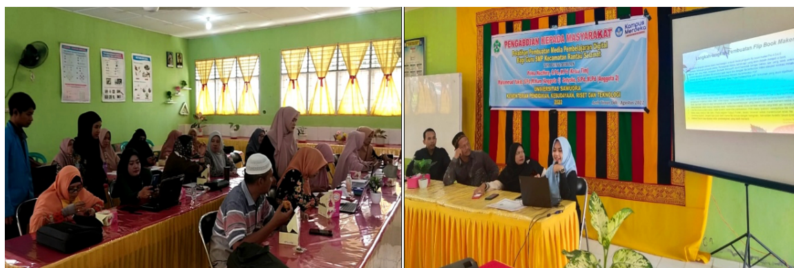
Gambar 3. Pelatihan Media Pembelajaran berbasis Digital

menjadi media pembelajaran. Bahan materi dipersiapkan dalam format ( pdf ) untuk pembuatan e-book , sedangkan bahan materi dipersiapkan untuk komik digital cukup menggunakan ( microsoft word ) atau power point . (4) Selanjutnya secara tutorial dengan tahapan step by step dijelaskan oleh instruktur dari tim PKM kepada seluruh peserta guru-guru di SMPN 1 Rantau Selamat. Aplikasi yang digunakan untuk mengembangkan media digital yaitu buku digital ( e-book ) dengan aplikasi flip yang tersedia dan mudah diakses secara gratis melalui link: https://fliphtml5.com , pengembangan komik digital menggunakan aplikasi canva , melalui link: http://www.canva.com . Media pembelajaran berbasis digital selesai dikembangkan dan siap untuk digunakan.