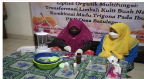
Gambar 5 Proses Pendampingan Bersama Mitra Secara Luring.

Melalui pelatihan ini dari hasil produksi yang dilakukan secara mandiri oleh mitra dapat dilihat dari pendampingan yang dilaksanakan sesuai protokol Kesehatan dengan tetap memakai masker dan menjaga jarak. Adapun yang menjadi kendala dalam pengolahan limbah kulit buah naga dan madu Trigona dapat dipecahkan agar permasalahan produksi dapat diminimalisir. Proses pendampingan ini dilaksanakan dalam rangka mengevaluasi kemampuan mitra dalam mengolah dan mengembangkan produk yang dihasilkan (Yasser et al. , 2020; Asfar et al. , 2021; Sumiai et al. , 2021; Asfar et al. , 2020).