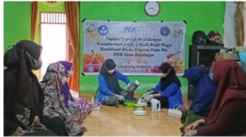
Gambar 3 Proses Pelatihan Bersama Mitra Secara Luring

Adapun alat dan bahan yang diperlukan dalam pembuatan Liptint Organik Multifungsi dilihat pada tabel 2 berikut ini.