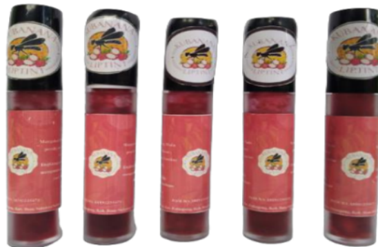
Gambar 6 Produk KUBANANA Liptint Organik Multifungsi

Adapun produk yang dihasilkan oleh mitra yaitu produk KUBANANA Liptint Organik Multifungsi dapat dilihat pada gambar berikut ini.