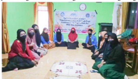
Gambar 2 Proses Sosialisasi Kepada Mitra Secara Luring

Penyuluhan yang dikarenakan berkaitan erat dengan seminar singkat yang berupa tudang sipulung tim pelaksana dan antara mitra sebagai bentuk pelibatan masyarakat dalam menyerap keterampilan yang diberikan secara by doing yaitu kegiatan yang dilakukan sebagai bentuk sosialisasi kepada mitra (Muliana et al. , 2020; Yasser et al. , 2019; Asfar et al. , 2020; Yasser et al. , 2020). Desa Batulappa merupakan salah satu desa di Kecamatan Patimpeng yang terkenal sebagai sentra budidaya buah naga. Hal ini didukung oleh program pemerintah sejak tahun 2018 hingga 2020 yang mengarahkan masyarakat dengan penggiatan melalui program penanaman buah naga, sehingga menghasilkan populasi tanaman buah naga semakin banyak. Berdasarkan hasil survei pertanian di Desa Batulappa, diperoleh bahwa dalam sebulan masyarakat mampu menghasilkan buah naga sebanyak 5 ton (BPS Kec. Patimpeng, 2019). Peningkatan konsumsi buah naga mengakibatkan keberadaan limbah kulit buah naga pasca konsumsi yang juga semakin banyak. Kulit buah naga selama ini tidak dimanfaatkan dan dibuang begitu saja oleh masyarakat karena dianggap limbah yang tidak bermanfaat sama sekali, dengan adanya penumpukan kulit buah naga yang tidak dimanfaatkan dengan baik serta sangat mengurangi estetika lingkungan. Di samping itu, Desa Batulappa dijuluki wilayah juga yang banyak membudidayakan lebah Trigona, sehingga diseminasi pengolahan limbah kulit buah naga dan madu Trigona menjadi produk KUBANANA Liptint Organik Multifungsi Ramah Lingkungan.