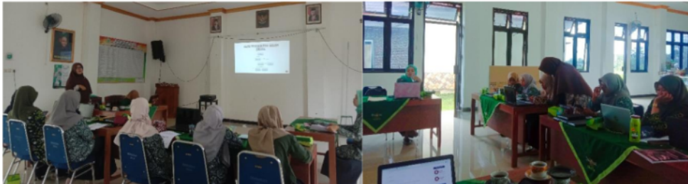
Gambar 1. Presentasi Teori Dasar Terkait Artikel Jurnal Ilmiah

secara penuh rangkain proses sampai seluruh peserta berhasil mengumpulkan topik. Peserta juga diajarkan cara membuat akun pada OJS, dan seluruh peserta yang hadir sudah dapat membuat akun di jurnal. Berikut beberapa foto proses pembekalan secara luring yang telah dilaksanakan: