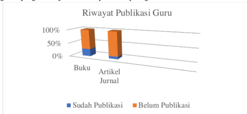
Grafik 1. Riwayat Publikasi Guru

Di MA Ma'arif NU Sains Al-Qur'an Sumbang, Banyumas yang merupakan mitra dalam program pengabdian ini, jumlah guru yang telah memiliki pengalaman publikasi artikel masih cukup rendah. Dari data yang diberikan oleh Kepala Sekolah, dari 11 guru hanya 1 (9,09%) yang pernah melakukan publikasi di jurnal, sedangkan sisanya (90,91%) belum pernah melakukan publikasi ilmiah di jurnal. Publikasi ilmiah yang sudah pernah dilakukan guru adalah publikasi ilmiah berupa buku. Tercatat ada 3 (27,27%) orang guru yang sudah menulis buku, sedangkan 8 (72,73%) guru belum pernah melakukan publikasi buku. Sebagai gambaran berikut grafik yang menunjukkan hasil publikasi para guru.