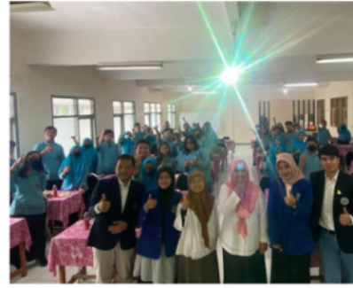
Gambar 1. Pelatihan Peningkatan Self Efficacy dan Self Esteem

Kegiatan pelatihan tahap pertama, dilaksanakan dengan metode tatap muka. Siswa yang hadir ialah keseluruhan kelas 3 SMA Lab, acara dibuka dan didampingi oleh Kepala Sekolah. Menurut (Nikmarijal, 2022) self-esteem dan self-efficacy semakin ditingkatkan ke arah positif, maka rasa percaya diri anak akan semakin meningkat. Begitu juga sebaliknya jika menurun, dan negatif maka akan sangat membahayakan anak termasuk pergaulan yang tidak sehat seperti penyalahgunaan narkoba, kenakalan, ketidakbahagiaan, depresi, gangguan makan. Peningkatan self-esteem ini tidak dapat dilakukan sendiri oleh siswa, tetapi membutuhkan peran orang lain, sosial termasuk di dalamnya orang tua, terlebih sekolah memfasilitasi untuk menggerakkan semangat untuk tumbuh ke arah positif (Hasanah, 2022). Siswa sesuai umurnya membutuhkan pengakuan dari pihak lain, reward terhadap prestasi mereka, jika itu tidak didapatkan dari lingkungan atau memang seharusnya dan selayaknya mendapatkan, maka akan muncul sifat rendah hati, tidak percaya diri dan tidak ada kemauan untuk berkembang (Ulhaq, 2022).