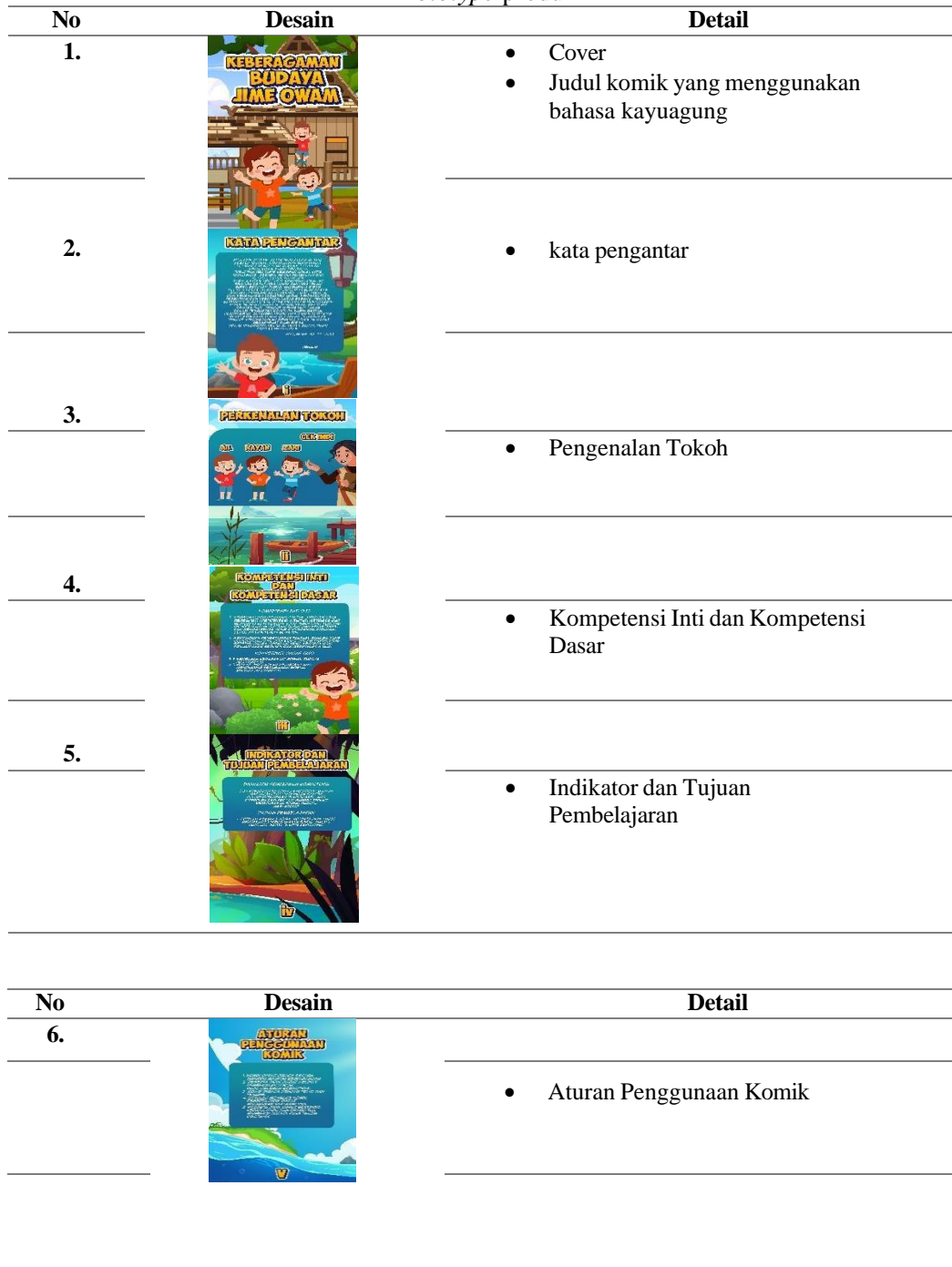
Tabel 1. Prototype produk