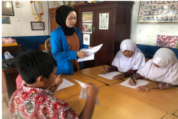
Gambar 1. Pengisian Angket one to one

(b) Kelompok Kecil ( Small Group ). Uji coba small group dilakukan oleh 8 siswa, terlebih dahulu diberikan arahan bagaimana cara mengisi angket pada lembar yang telah diberikan oleh peneliti. Hal ini sama dengan uji coba one to one . Namun bedanya, pada tahap ini siswa yang diajak untuk memberikan angket respon mereka berjumlah 8 siswa. Berdasarkan hasil uji coba small group di atas diperoleh nilai rata-rata 89,6% dengan kriteria “sangat praktis”. Kesimpulan dari angket small group (Kelompok Kecil) mendapatkan nilai rata-rata 90 %. Maka dapat dinyatakan produk media PAKAPA (Papan Kata IPA) sangat praktis untuk digunakan.