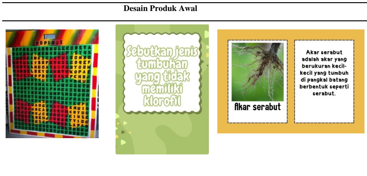
Tabel 1. Desain Awal Produk

(3) Tahap development : pada tahap pengembangan terdapat beberapa langkah yaitu validasi ahli, media dan bahasa. Yang dimana pada tahap ini dimana peneliti akan