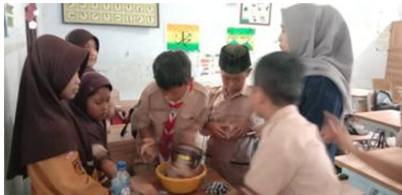
Gambar 3. Pembuatan Es Krim

Langkah awal pembuatan es krim yaitu campurkan bahan utama seperti Pop Ice, santan, dan air mineral ke dalam kaleng sesuai takaran yang diinginkan, lalu aduk hingga tercampur rata menggunakan sendok. Setelah itu, siapkan baskom yang isi dengan es batu, lalu tambahkan garam (halus atau kasar) dan aduk hingga merata. Letakkan kaleng yang berisi campuran es krim ke dalam baskom, tepat di tengah es batu. Tutup rapat kaleng, kemudian goyang-goyang atau putar kaleng secara terus menerus di dalam es batu agar campuran es krim membeku. Setelah sekitar 20-25 menit, buka kaleng dan lihat apakah es krim sudah mengental seperti pasta es krim. Jika sudah, es krim dapat disajikan ke dalam gelas plastik yang telah disiapkan masing-masing kelompok. Proses eksperimen ditampilkan pada Gambar 3.