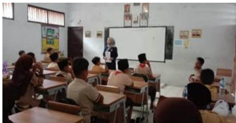
Gambar 1. Menentukan Pertanyaan Mendasar

pendekatan STEM. Hal ini terlihat dari hasil analisis statistik deskriptif, di mana nilai rata-rata pre-test siswa 15,05, sementara nilai post-test menjadi 24,68. Perbedaan ini mengindikasikan terdapatnya selisih rata-rata senilai 9,82 poin, yang mengindikasikan peningkatan kemampuan siswa setelah diterapkannya pembelajaran berbasis STEM dengan model pembelajaran PjBL pada materi wujud zat dan perubahannya. Sintak dalam pembelajaran model PjBL terdiri dari enam tahapan diantaranya : 1) merumuskan pertanyaan mendasar, 2) merancang proyek, 3) melakukan penyusunan jadwal proyek, 4) memantau perkembangan proyek, 5) melakukan penilaian hasil, 6) evaluasi pengalaman. Penerapan model pembelajaran ini diharapkan mampu mendorong kreativitas peserta didik di SDN 5 Ngawen, sebagaimana ditunjukkan dalam Gambar 1.