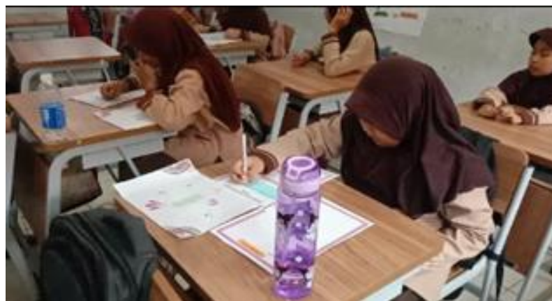
Gambar 2. Membuat Desain dan Menyusun Jadwal

Gambar 1. Mengindikasikan tahapan menentukan pertanyaan mendasar, siswa dibimbing melalui diskusi kelompok untuk mengidentifikasi permasalahan mengenai materi wujud zat dan perubahannya. Tahapan ini mempunyai tujuan dalam menemukan rasa ingin tahu siswa melalui cara mengajukan pertanyaan yang berkaitan dengan konsep ilmiah, kontekstual dan dekat dengan kehidupan sehari-hari, mendorong pelajar dalam bereksperimen serta mencari solusi. Tahapan sintak selanjutnya membuat desain dan menyusun jadwal untuk eksperimen yang ada dalam Gambar 2.