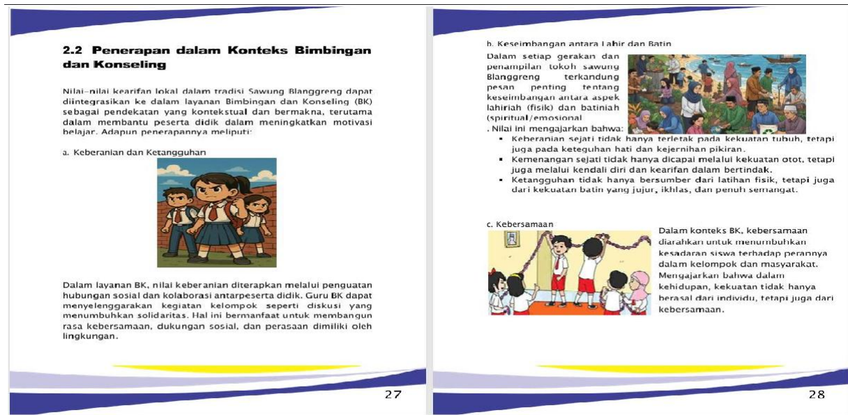
Gambar 1. Desain dan Konten Modul

bertujuan untuk mengetahui kebutuhan siswa serta kesesuaian materi dengan konteks budaya lokal. Peneliti menganalisis kurikulum yang berlaku, berdiskusi dengan guru, serta mengamati proses belajar siswa. Dari hasil analisis, diperoleh gambaran bahwa siswa membutuhkan bahan ajar yang lebih kontekstual agar pembelajaran terasa dekat dengan kehidupan mereka. Filosofi Sawung Blanggreng dipilih karena budaya ini mengandung pesan ketekunan, kebersamaan, dan pantang menyerah yang relevan dengan karakter growth mindset , serta bermanfaat bagi peningkatan growth mindset para pelajar.