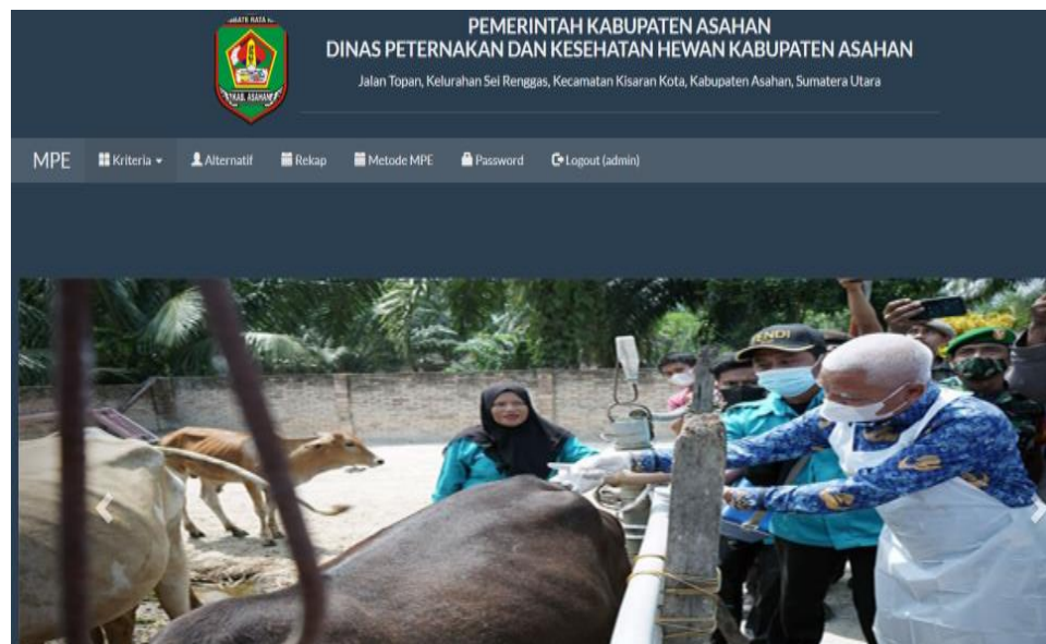
Gambar 4. Menu utama

Gambar 3 menampilkan menu login , yang dimana pengguna memasukkan user dan password yang digunakan. Selanjutnya pada gambar 4 merupakan menu utama yang terdiri dari menu-menu dan sub menu yang terdapat pada sistem admin yang telah dirancang