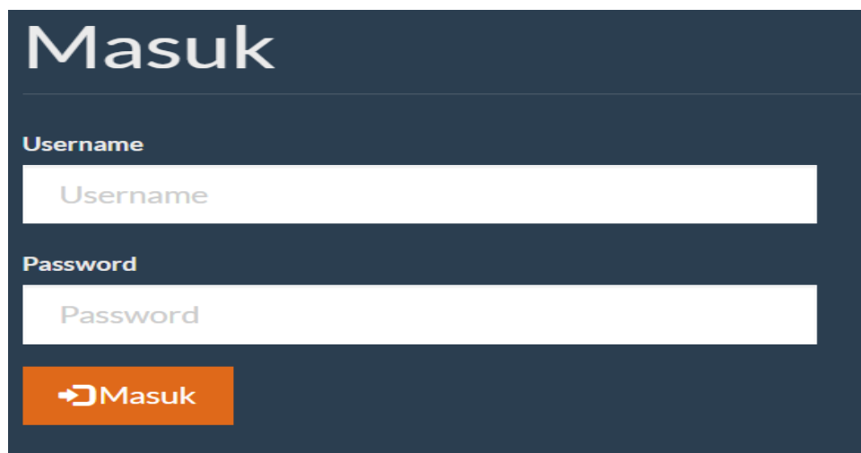
Gambar 3. Menu login

Selanjutnya pada gambar 2 adalah flowchart nilai bobot kriteria yang menampilkan menu form nilai bobot kriteria, kemudian program akan menampilkan berbagai macam menu seperti: Jika admin memilih menu tambah nilai bobot kriteria, maka sistem akan menampilkan di menu form tambah nilai bobot kriteria, begitu seterusnya. Dan selanjutnya hasil implementasi sistem kami menunjukkan bahwa terdiri beberapa menu yang ditampilkan yang terdiri dari menu utama, halaman login , dan beberapa menu lainnya.