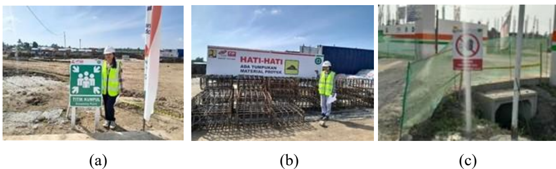
Gambar 3. Rambu K3 (a) rambu titik kumpul (b) rambu peringatan berbahaya (c) rambu Larangan

Pada aspek rambu dan fasilitas K3, hasil observasi menunjukkan bahwa rambu keselamatan telah tersedia pada beberapa titik strategis seperti area masuk proyek, zona alat berat, dan area pekerjaan berisiko tinggi.