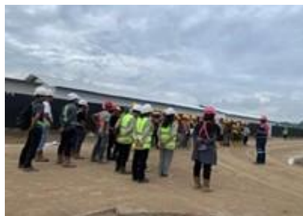
Gambar 5. Pelaksanaan Safety Talk (TBM)

Pada aspek pekerjaan berisiko tinggi, seperti pekerjaan di ketinggian, pengangkutan material, dan penggunaan alat berat, ditemukan bahwa pengendalian teknis telah diterapkan melalui scaffolding, SOP kerja, serta pengaturan area kerja. Namun, pengawasan terhadap perilaku pekerja masih menjadi titik lemah dalam implementasi K3. Hal ini menunjukkan bahwa pendekatan K3 di proyek masih dominan pada aspek engineering control, sementara aspek behavioral control belum berjalan optimal. Temuan ini konsisten dengan Maulani et al, (2025) yang menegaskan bahwa pengendalian kecelakaan kerja tidak hanya bergantung pada peralatan, tetapi juga disiplin tenaga kerja. Pada aspek pengawasan oleh HSE, ditemukan bahwa safety briefing harian dan inspeksi rutin telah dilakukan secara konsisten.