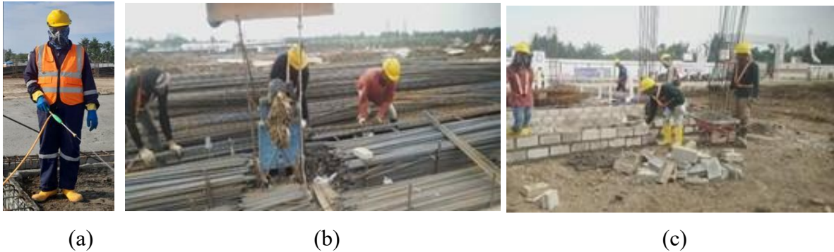
Gambar 2. Penggunaan APD sesuai dengan pekerjaan (a) penyemprotan anti rayap (b) pekerjaan pembesian (c) pekerjaan struktur

Temuan ini menunjukkan bahwa secara sistem, penyediaan APD oleh kontraktor telah berjalan baik dan sesuai ketentuan peraturan UU No. 1 Tahun 1970 dan Permenaker No. 8 Tahun 2010. Namun demikian, kepatuhan penggunaan APD belum sepenuhnya konsisten pada seluruh pekerja, khususnya pada penggunaan body harness di pekerjaan ketinggian. Kondisi ini mengindikasikan bahwa meskipun aspek teknis sudah tersedia, faktor perilaku pekerja masih menjadi tantangan utama dalam implementasi K3. Hal ini sejalan dengan penelitian Putri et al, (2025) yang menyatakan bahwa kecelakaan kerja di sektor konstruksi lebih banyak dipengaruhi oleh tindakan tidak aman ( unsafe act ) dibandingkan kondisi tidak aman.