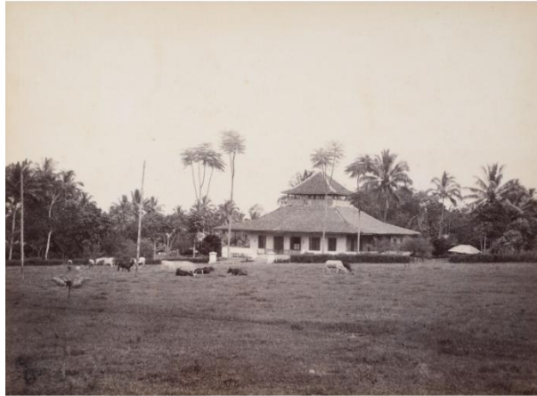
Gambar 1. Masjid Jamie Sukabumi pada akhir abad ke-19