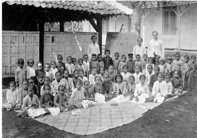
Gambar 3. Fröbelschool dan sekolah menjahit milik Perkumpulan Misionaris Belanda di Pangharepan, Sukabumi

Awalnya NZV menargetkan orang lokal Sunda untuk kegiatan misionarisnya, tetapi di tahun-tahun berikutnya mereka juga mencoba memasukkan orang Tionghoa (Bamualim, 2015). Hal ini dikarenakan mereka menemukan banyak orang Tionghoa di pesisir utara telah memeluk agama Kristen (End, 2006). Penambahan fokus ini nyatanya menghasilkan peluang yang baik bagi mereka. Masyarakat Tionghoa yang beragama Kristen dengan peran sebagai Pekabar Injil mempermudah penyebaran agama Kristen di wilayah Kota Sukabumi karena stigma yang diciptakan masyarakat pribumi pada orang-orang Belanda. Putri (2023) menyatakan penyebaran Kristen yang dilakukan oleh orang Belanda ( urang Walanda ) pada masyarakat pribumi adalah bagian dari penjajahan. Maka dari itu, jemaat-jemaat Tionghoa menjadi penyelamat NZV menyebarkan agama Kristen melalui pendekatan personal yang dilakukannya, contohnya dengan datang ke rumah-rumah masyarakat (Putri et al., 2023).