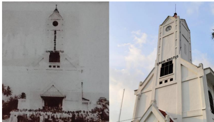
Gambar 6. (kiri) Gereja Sidang Kristus (GSK) dengan tulisan Mandarin sekitar tahun 1940 dan (kanan) bangunan gereja saat ini setelah pembatasan budaya Tionghoa masa Orde Baru

oleh pemerintah. Beberapa ritual seperti sembahyang Ceng Beng , sembahyang Cioko , sembahyang Se Jit , Tiong Ciu dan sembahyang pada Kongco , dilakukan secara sederhana dan terbatas hanya dilaksanakan di klenteng (Siong & Muliadi, 2012). Bahkan dalam konteks lain, Gereja Sidang Kristus (GSK) yang difungsikan sebagai gereja bagi masyarakat Tionghoa Protestan juga diharuskan menanggalkan tulisan Mandarin yang besar melekat pada bagian depan gereja (Wawancara dengan Andreas, 28 Maret 2024).