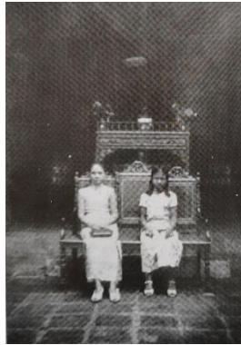
Gambar 5. Foto umat kelenteng di depan meja Thi-kong vihara tahun 1920.