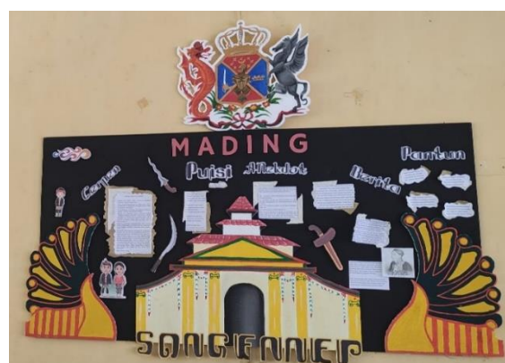
Gambar 2. Mading kelas dengan tema sejarah

Pada proses implementasi GLS dalam pelajaran sejarah di SMAN 1 Sumenep terdapat hal yang berbeda dan juga ada yang sama jika dibandingkan dengan isi pada panduan GLS. Hal yang berbeda terlihat pada proses membaca 15 menit, hal tersebut di SMAN 1 Sumenep sering kali dilakukan dalam bentuk penugasan membaca pada pertemuan sebelumnya. Sehingga proses membaca dilakukan siswa tidak ketika jam pelajaran sejarah melainkan dilakukan di rumah. Bentuk realisasi strategi pembelajaran yang kaya akan teks sebenarnya telah terlihat di SMAN 1 Sumenep, salah satu bentuknya merupakan pembuatan mading kelas. Mading tersebut tidak hanya sebagai tempat untuk menempelkan hasil karya siswa pada umumnya. Terdapat tema dan konsep sejarah yang di terapkan dalam model mading kelas tersebut, selain itu isi dari karya yang kaya akan teks oleh para siswa juga memiliki tema besar tentang sastra dan kesejarahan.