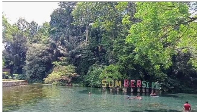
Gambar 2. Wisata Alam Sumber Sira

Indonesia sendiri dikenal sebagai negara yang memiliki banyak destinasi pariwisata. Hal itu terbukti seperti yang berada di Provinsi Jawa Timur terdapat potensi tinggi di bidang pariwisata. Salah satu pusat industri pariwisata di Jawa Timur ialah Kabupaten Malang, Kabupaten Malang ini memiliki destinasi wisata yang terletak di Desa Putukrejo, Kecamatan Gondanglegi, Kabupaten Malang yaitu Sumber Sira. Sumber Sira menjadi salah satu aset desa potensial yang berada di Desa Putukrejo, Kecamatan Gondanglegi, Kabupaten Malang. Salah satu aset desa ini dikatakan potensial karena dimanfaatkan oleh penduduk sekitar untuk menjalani kehidupan sehari-hari. Misalnya seperti yang dimanfaatkan oleh para penduduk untuk mengairi sawah irigasi. Sumber Sira ini sekarang telah menjadi lapangan pekerjaan bagi masyarakat sekitar, khususnya penduduk sekitar Desa Putukrejo. Sumber sira memungkinkan akan dapat terus berkembang terlebih apabila salah satu aset desa ini terus dikelola secara profesional dan baik.