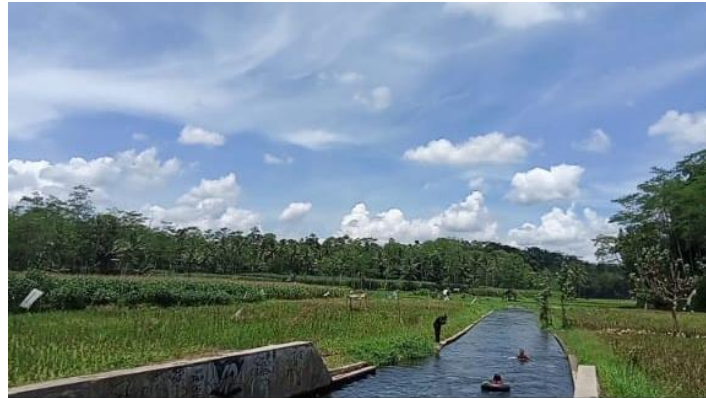
Gambar 3. Pemandangan Alam Sumber Sira

tarik wisatawan untuk berkunjung ke tempat wisata alam Sumber Sira karena menyimpan keindahan alam yang khas tersendiri.