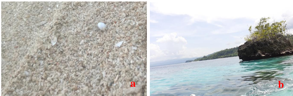
Gambar 6. a) Material Gisik pantai Labuan Lemo, b) Barrier (Terumbu Karang dan Pulau Kecil) di Pantai Labuan Lemo

bahwa kecerahannya berkisar diangka >6 meter dalam kondisi cuaca yang cerah. Hal ini tentunya membuat pemandangan bawah laut terlihat lebih bagus dan jelas dengan kondisi cuaca yang cerah.