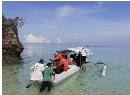
Gambar 2. Kapal/perahu nelayan dipakai sebagai akses jalur laut

Pantai-pantai yang ada di kawasan pesisir Desa Sabang dapat dijangkau dengan jalur darat dan laut. Akses jalan dari pusat keramaian masyarakat sudah baik untuk dilewati oleh kendaraan kecil maupun besar. Namun ada beberapa pantai yang tidak dapat diakses melalui jalur darat melainkan harus dari jalur laut. Misalnya akses ke pantai Bambarano dapat ditempuh menggunakan kendaraan pribadi ataupun umum (lokal), sedangkan akses menuju pantai Salur dan Labuan Lemo hanya menggunakan perahu/kapal atau bisa dengan berjalan kaki (waktu tempuh yang lama dan susah). Hal ini berlaku bagi wisatawan yang hendak melancong ke pantai Salur terlebih dahulu menyewa kapal/perahu nelayan dengan perjalanan untuk sekali pulang pergi sebesar Rp. 30.000,- per orang.