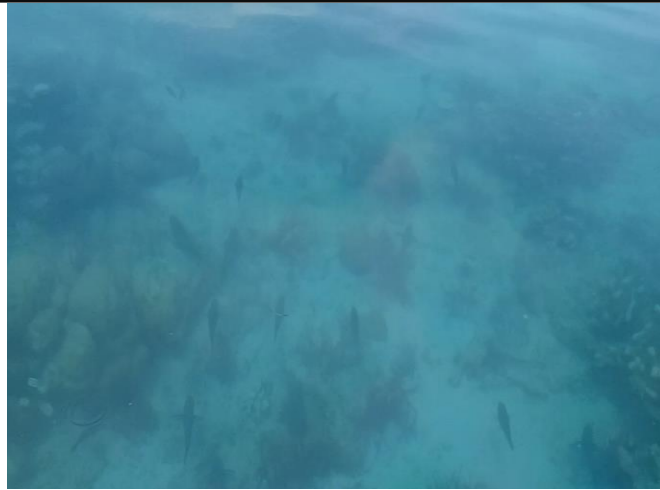
Gambar 6. Pemandangan bawah laut Pantai Salur

Topografi daratan pesisir yang berombak dan kecuraman lereng pantai yang landai bergelombang mempengaruhi jangkauan pasang surut. Jangkauan litoral pantai Salur mencapai 17 meter pada bagian timurnya, sedangkan bagian barat mencapai 28 meter. Perbedaan jangkauan litoral tersebut dikarenakan oleh lebar gisik pantai semakin ke Barat itu melebar. Berdasarkan hasil perhitungan didapatkan bahwa jangkauan pasang surut di pantai Salur berkisar diantara angka 26,89 meter. Jangkauan Pasang Surut Litoral yang cukup hanya memberikan kesempatan yang kurang banyak bagi energi gelombang laut untuk mengikis pantai.