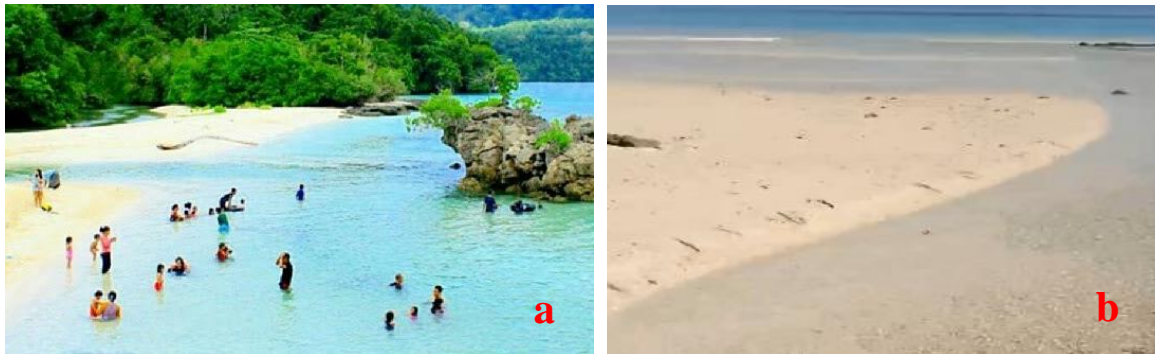
Gambar 3. a) Aktivitas wisatawan di Pantai Bambarano, b) Muara Sungai Bambarano

Pantai Bambarano merupakan objek wisata pantai yang cukup ramai dikunjungi oleh wisatawan, baik domestik maupun mancanegara. Pantai ini merupakan pantai yang paling mudah diakses oleh wisatawan atau masyarakat serta berada di sebelah timur pesisir Desa Sabang dengan jarak 2 km dari pusat keramaian masyarakat. Secara umum pantai ini menyuguhkan panorama eksotis yang banyak dimanfaatkan untuk swafoto, rekreasi, piknik, dan lain-lain (lihat Gambar 3a). Secara morfologi, bentuk pantainya menjorok ke laut (bertanjung) dan memiliki muara sungai. Asal muara sungai di Pantai Bambarano merupakan aliran sungai bawah tanah (gua) yang berasal dari Danau Dampelas di Desa Talaga (Gambar 3b). Kemiringan lereng pantainya landai bergelombang. Hal ini membuat morfologinya memiliki dinamika yang cukup tinggi.