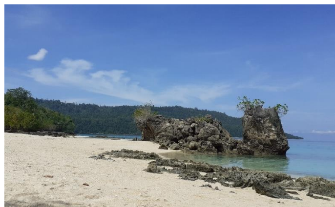
Gambar 4. Barrier di Pantai Bambarano

Adanya penghalang pantai ( barrier ) berupa Pulau kecil (lihat gambar 4) dan Terumbu karang cukup kuat untuk menahan ombak, sehingga pantai Bambarano tidak mudah tererosi (Abrasi) sebagai akibat lereng gisik pantainya yang landai. Semakin ke Barat lebar gisik pantai Bambarano menyempit yakni berkisar diangka 3-10 m. Pantai Bambarano memiliki topografi gisik yang landai dan pantainya memanjang dari Timur ke Barat dengan bentuk garis pantai yang cukup lurus dan berkelok. Berdasarkan hal tersebut pantai Bambarano dapat dikategorikan sebagai pantai yang bentuk garisnya tak beraturan. Sedimentasi/material gisik pantai Bambarano terdapat pasir kasar dan halus yang berwarna kuning keputihan. Tetapi pasir kasar lebih mendominasi material gisiknya.