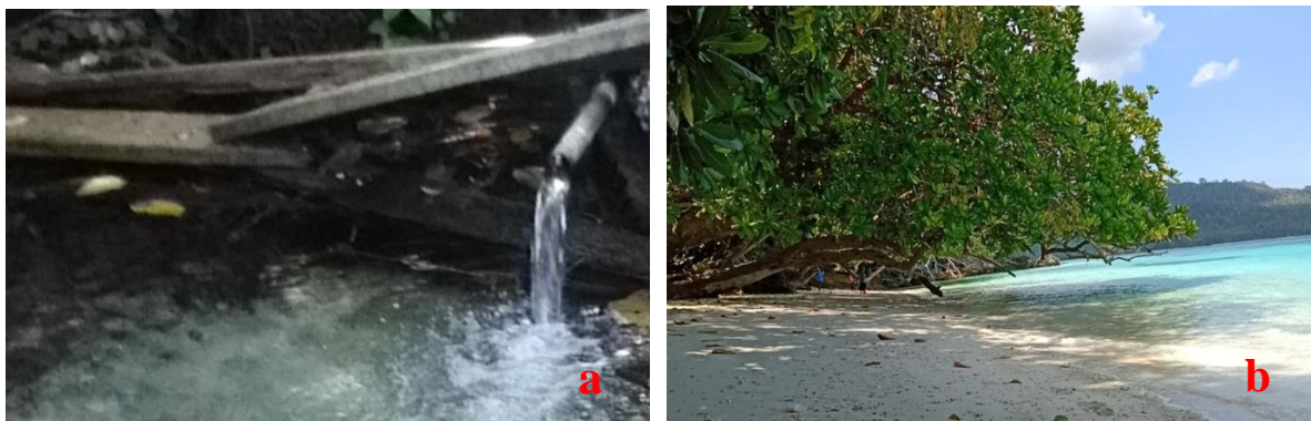
Gambar 5. a) Sumber Air Tawar Pantai Salur, b) Landscape Pantai Salur

Pantai Salur merupakan objek wisata kedua di Desa Sabang yang cukup ramai dikunjungi oleh wisatawan (setelah Pantai Bambarano). Pantai ini terletak di sebelah Barat pantai Bambarano. Di pantai ini terdapat sumber air tawar yang berasal dari gunung/bukit Desa Sabang, yang juga memiliki histori mitologi (lihat gambar 5a). Menurut mitologi masyarakat setempat, siapa saja pasangan (belum sah secara agama dan hukum) mandi di mata air tersebut maka dipastikan akan menjadi pasangan seumur hidup. Pantai Salur adalah salah satu pantai yang tidak dapat dijangkau atau diakses melalui kendaraan darat. Sehingga memerlukan kapal/perahu untuk bepergian ke Pantai Salur. Pantai tersebut menyuguhkan pemandangan yang sangat indah dan banyak dimanfaatkan untuk swafoto, rekreasi dan lain-lain (lihat gambar 5b). Bentuk pantainya yang agak menjorok ke darat (berteluk). Kemiringan lereng pantainya landai bergelombang. Hal ini membuat morfologinya memiliki dinamika yang cukup tinggi.