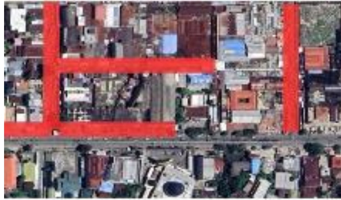
Gambar 5. Lokasi Sirkulasi di Kawasan Pasar Besar