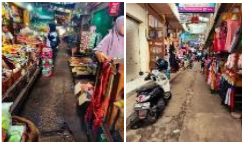
Gambar 8. Analisis spasial dan fungsional Blauran