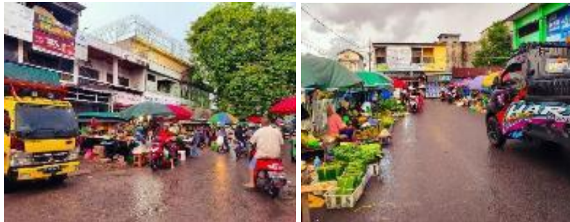
Gambar 6. Analisis Sirkulasi di Kawasan Pasar Besar