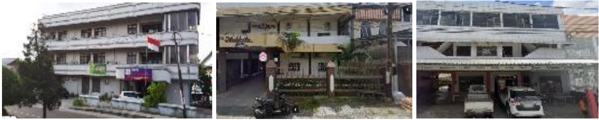
Gambar 10. Kondisi bangunan di kawasan Pasar Besar

Pasar, kawasan Blauran , dan hotel membentuk satu sistem kawasan komersial yang saling bergantung secara fungsional. Pasar berperan sebagai pusat aktivitas ekonomi, kawasan Blauran sebagai ruang transisi yang menampung aktivitas informal, dan hotel sebagai pendukung jasa serta mobilitas. Namun, ketiga elemen tersebut belum terintegrasi secara spasial dan arsitektural. Ketiadaan konsep penataan kawasan terpadu menyebabkan potensi kawasan belum dimanfaatkan secara optimal dan berdampak pada penurunan kualitas ruang publik.