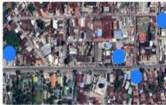
Gambar 7. Lokasi Penelitian Hotel, Pasar, dan Blauran sebagai Kawasan Komersial