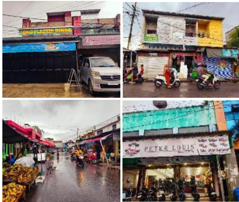
Gambar 2. Kondisi Eksisting Pasar Besar (Sumber: Dokumentasi peneliti, 2025)

Kondisi topografi kawasan Pasar Besar relatif datar sehingga tidak menjadi kendala utama pengembangan aktivitas. Namun kepadatan bangunan menyebabkan permasalahan lingkungan seperti keterbatasan drainase dan potensi genangan air pada saat musim hujan seperti terlihat di Gambar 2. Orientasi bangunan umumnya menghadap ke koridor jalan utama, menunjukkan bahwa nilai ekonomi ruang sangat dipengaruhi oleh visibilitas dan aksesibilitas. Sirkulasi di dalam tapak menunjukkan tumpang tindih antara jalur kendaraan dan pejalan kaki. Jalur bongkar muat, parkir, dan pergerakan pejalan kaki belum terpisah secara jelas, sehingga menurunkan kenyamanan dan keselamatan pengguna. Dari aspek lingkungan, minimnya ruang terbuka hijau dan dominasi permukaan keras menyebabkan kualitas iklim mikro kawasan belum optimal. Analisis tapak menunjukkan bahwa Kawasan Pasar Besar Palangka Raya memiliki potensi strategis yang tinggi sebagai pusat aktivitas komersial kota. Namun potensi tersebut belum diimbangi dengan penataan tapak yang terintegrasi. Oleh karena itu, diperlukan pendekatan perancangan kawasan yang mempertimbangkan keterpaduan fungsi, kualitas ruang, dan keberlanjutan lingkungan.