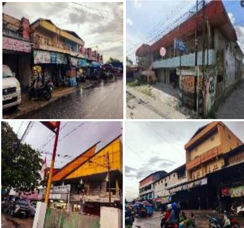
Gambar 4. Kondisi Eksisting Bangunan di Kawasan Pasar Besar