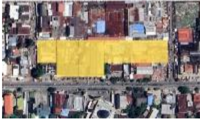
Gambar 3. Lokasi Bangunan di Kawasan Pasar Besar