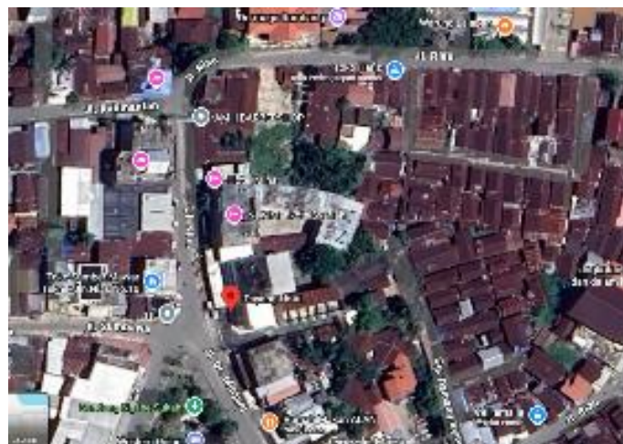
Gambar 9. Lokasi Hotel di Kawasan Pasar Besar

Hotel, dan Blauran di sekitar Kawasan Pasar Besar Palangka Raya berfungsi sebagai fasilitas pendukung aktivitas perdagangan dan jasa kota sebagai bagian dari analisa bangunan komersial (Gambar 9). Secara spasial, bangunan hotel memiliki orientasi yang lebih teratur mengikuti jaringan jalan utama dan menampilkan karakter arsitektur yang lebih formal dibandingkan bangunan pasar dan kawasan Blauran . Keberadaan hotel memperpanjang durasi aktivitas kawasan hingga malam hari dan keberadaan hotel mengingatkan pada wisatawan akan nostalgia Ketika tepian Sungai ramai di era tahun 1970 an sampai 1990 (Gambar 10).