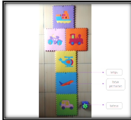
Gambar 3 Desain Media Permainan Sunda Manda Robot Bercahaya sesudah revisi

Berdasarkan masukan dari berbagai pihak maka desain media permainan sunda manda robot bercahaya berubah menjadi seperti yang terlihat pada gambar 3.