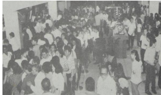
Gambar 3. Nasabah datangi BCA Cabang Medan di Jalan Bukit Barisan

berkurang nasabah yang datang ke BCA. Namun, seluruh cabang BCA tetap membuka layanan untuk berjaga-jaga apabila terdapat nasabah yang hendak menarik dananya bahkan di hari Sabtu tetap buka (Analisa, 1997g).