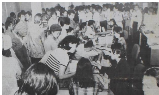
Gambar 5. Serbuan nasabah Bank Danamon di Jalan Pemuda, Medan

Bank Danamon yang berada di Bali tepatnya di Jalan Gunung Agung pada hari Senin, 6 April 1998 terjadi rush sejak pagi. Peningkatan jumlah nasabah menyebabkan beberapa nasabah tidak dapat masuk sehingga hanya bisa menunggu di tangga. Selain itu, terdapat nasabah yang berkerumun di depan loket bank. Serbuan nasabah tersebut terlihat hingga menjelang sore hari, beberapa petugas bank juga melayani nasabah untuk mendapatkan informasi melalui telepon. Karyawan dan Satpam juga terlihat baru saja mengambil karung uang dari Bank Indonesia (Bali Post, 1998d).