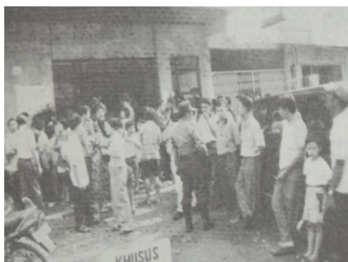
Gambar 2. Serbuan nasabah di ATM BCA, Kantor Capem Medan di Jalan Asia.