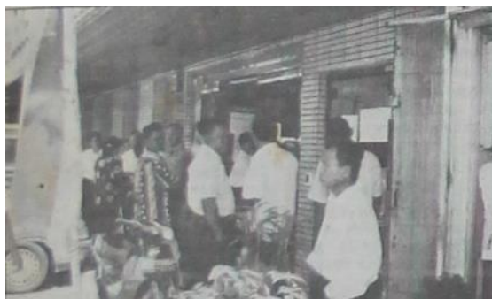
Gambar 1. Bank Danamon Medan ramai didatangi nasabah

menarik dana melalui tabungannya maupun deposito. Penarikan dana dari bank yang sehat juga terjadi di Tebing Tinggi yaitu Bank Central Asia (BCA), Lippo Bank dan Bank Danamon. Ketiga bank swasta tersebut kewalahan dalam menghadapi serbuan nasabah yang ingin mengambil uang. Meskipun begitu, ketiga bank tersebut tetap melayani nasabah dengan baik tanpa mempertimbangkan jumlah nominal yang diambil (Analisa, 1997d).