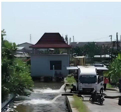
Gambar 1. Pompanisasi banjir rob oleh BPBD Kabupaten Demak

Mitigasi bencana berbasis hard structure seperti pompanisasi memang telah diimplementasikan sebagai upaya preventif jangka pendek, namun efektivitasnya masih menghadapi kendala struktural, khususnya pada sistem pembuangan air. Keterbatasan ini menunjukkan pentingnya penerapan mitigasi soft structure yang berorientasi pada penguatan aspek sosial dan kelembagaan.