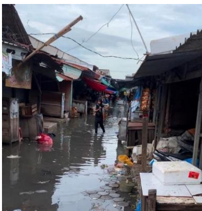
Gambar 4. Aktivitas Masyarakat di Pasar yang Terdampak Banjir Rob

norma ini menunjukkan bahwa nilai dan norma ikhtiar dan tawakal berfungsi untuk memperkuat resiliensi masyarakat dalam menghadapi banjir rob yang semakin memburuk setiap harinya.