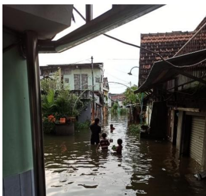
Gambar 3. Aktivitas Anak-Anak Bermain di Tengah Banjir Rob

Hidayat et al., (2026) menjelaskan bahwa ikhtiar tidak hanya dipahami sebagai usaha individual, tetapi juga sebagai praktik kolektif yang berulang dan berkembang menjadi norma religius yang mendorong individu untuk tetap berusaha secara sungguh-sungguh dalam menghadapi risiko.