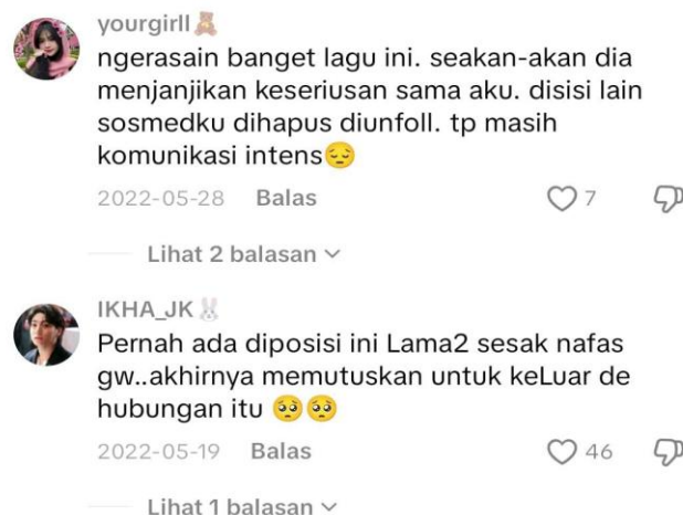
Gambar 2, https://vt.tiktok.com/ZSPuNzj4t/

Berdasarkan peninjauan terhadap komentar-komentar pendengar pada video musik lagu “Rumah Singgah”, dapat dilihat bahwa lagu ini lebih banyak dimaknai sebagai lagu galau yang merefleksikan kekecewaan dan luka emosional dalam sebuah hubungan yang tidak memiliki kepastian. Beberapa komentar menunjukkan bahwa pendengar menangkap pesan lagu sebagai bentuk peringatan agar tidak terlalu membuka hati kepada seseorang yang masih ragu atau belum selesai dengan masa lalunya. Lagu ini tidak dipahami sebagai ungkapan cinta yang indah, melainkan sebagai cerminan pengalaman pahit ketika seseorang hanya dijadikan tempat singgah tanpa komitmen yang jelas.