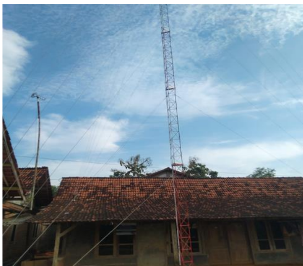
Gambar 3 Pengadaan wifi menggunakan tower

Langkah ini menunjukkan bahwa pembangunan digital di kawasan perdesaan bukan sekadar wacana, melainkan suatu kenyataan yang dapat diwujudkan secara konkret. Implementasi layanan WiFi desa yang dikelola oleh BUMDes di Desa Krocok menjadi bukti nyata bahwa transformasi digital dapat terjadi di tingkat desa. Transformasi ini tidak hanya mengubah cara masyarakat mengakses informasi, tetapi juga membawa dampak signifikan terhadap peningkatan kesejahteraan warga. Akses internet yang lebih merata telah membuka peluang baru dalam bidang pendidikan, ekonomi, dan pelayanan publik, sekaligus memperkuat partisipasi masyarakat dalam pembangunan lokal yang berkelanjutan.