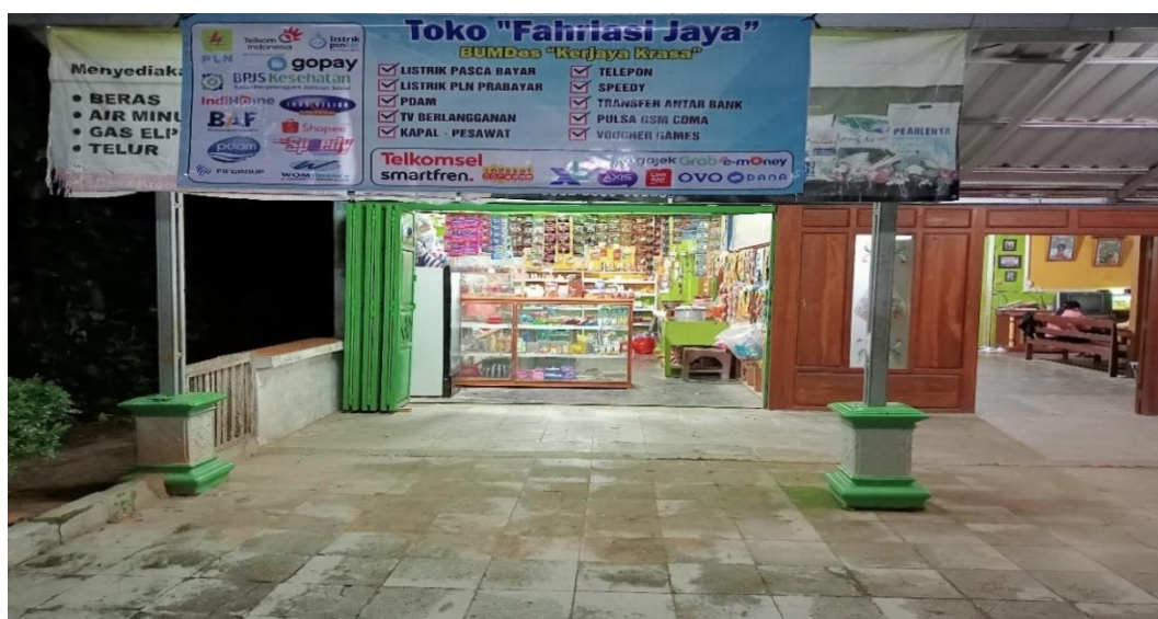
Gambar 4 Warung Warga Penyedia Layanan Pembayaran Non-Tunai

Beberapa layanan non-tunai seperti PPOB ( Payment Point Online Bank ), e-wallet , dan pembayaran berbasis QRIS mulai difasilitasi oleh BUMDes untuk kemudahan transaksi masyarakat. Observasi lapangan yang diperkuat melalui wawancara pribadi bersama Bapak Ali Mashud pada Selasa, 29 April 2025, mengungkapkan bahwa BUMDes Kerjaya Krasa Desa Krocok telah mengambil peran penting dalam mendukung ekosistem layanan keuangan digital di tingkat desa.