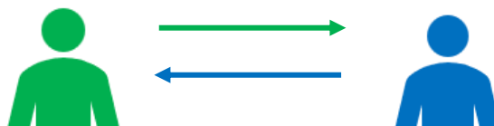
Diagram 2 Skema Model Pewarisan Pengetahuan Pengobatan Wong Pinter secara Horizontal

Model pewarisan secara diagonal dapat bersifat eksoterik karena sumber pembelajarannya dapat diakses oleh siapa saja tanpa terikat oleh genetik. Perlu adanya selektivitas pada seseorang yang ingin belajar pengetahuan pengobatan tradisional melalui jalur transmisi diagonal. Seseorang harus selektif dalam menentukan guru yang tepat sesuai dengan jenis ilmu yang diinginkan. Pengambilan keputusan yang tidak tepat akan berakibat pada inkoheren pengetahuan dan disposisi dalam pengaplikasiannya di masyarakat (Kalu, 2022).