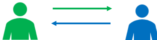
Diagram 2 Skema Model Pewarisan Pengetahuan Pengobatan Wong Pinter secara Horizontal

Model pewarisan secara diagonal dapat bersifat eksoterik karena sumber pembelajarannya dapat diakses oleh siapa saja tanpa terikat oleh genetik. Perlu adanya selektivitas pada seseorang yang ingin belajar pengetahuan pengobatan tradisional melalui jalur transmisi diagonal. Seseorang harus selektif dalam menentukan guru yang tepat sesuai dengan jenis ilmu yang diinginkan. Pengambilan keputusan yang tidak tepat akan berakibat pada inkoheren pengetahuan dan disposisi dalam pengaplikasiannya di masyarakat (Kalu, 2022).