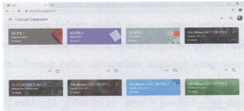
Gambar2. Tampilan kelas-kelas pada google classroom

Langkah kedua , klik lanjutkan untuk memulai membuat kelas dengan menggunakan google classroom , maka akan keluar tampilan sebagai berikut.