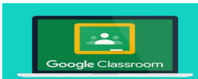
Gambar 1. Tampilan awal google classroom

Langkah-langkah yang dilakukan dalam membuat google classroom , yakni langkah pertama , membuka www.classroom.google.com , kemudian sign in untuk memulai membuka ruang kelas pada google classroom , maka akan keluar tampilan awal google classroom , seperti berikut.