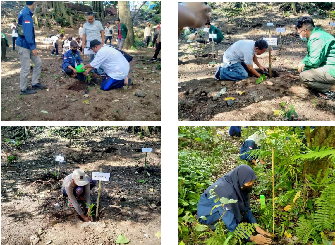
Gambar 3. Kegiatan Penanaman Bibit Pohon Bersama

Kegiatan penanaman yang dilakukan masyarakat juga perlu diberikan pendampingan dari pihak kampus dan juga pengelola Taman Nasional dalam hal ini Balai Kesatuan Pengelolaan Hutan (BKPH) Rinjani Timur, hal ini dikarenakan tidak semua masyarakat memiliki pengetahuan dan keterampilan konservasi. Kegiatan pendampingan tidak hanya memberikan masukan teori juga menampung kreativitas masyarakat yang secara tidak langsung dapat digunakan sebagai bahan untuk kajian pengembangan program selanjutnya.