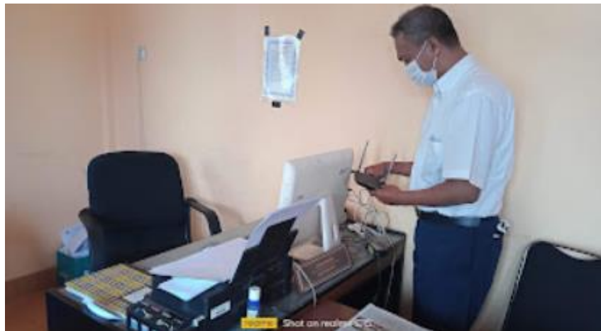
Gambar 4. Pengecekan, Instalasi dan Konfigurasi Jaringan