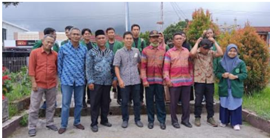
Gambar 6. Dokumentasi Selesai kegiatan