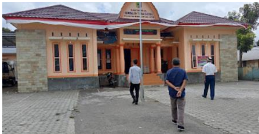
Gambar 2. Tiba di Kantor Desa Timba Gading