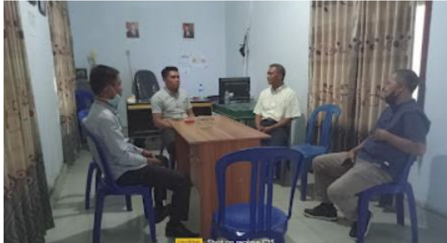
Gambar 3. Koordinasi dengan pihak Desa