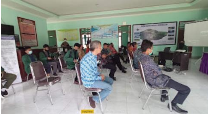
Gambar 5. Proses pendampingan dan pelatihan