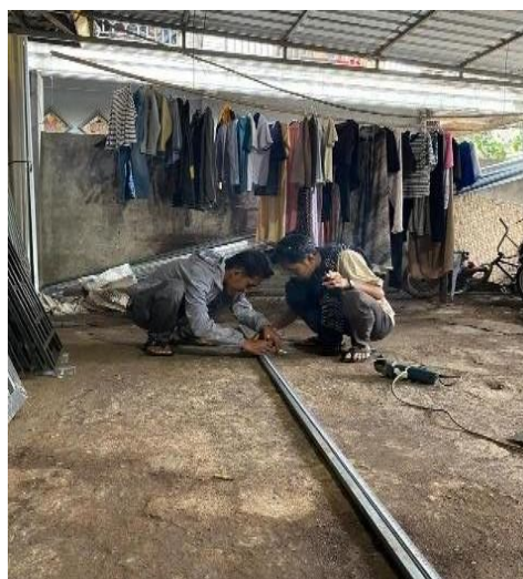
Gambar 3. Pemotongan Rangka

Pembuatan rangka dudukan komponen bertujuan untuk menempatkan sensor dan komponen utama sistem agar terpasang dengan baik. Proses pembuatan rangka meliputi pemotongan material rangka, perakitan rangka, pembersihan hasil sambungan, serta proses pengecatan rangka.