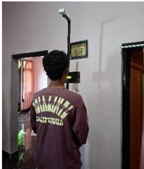
Gambar 7. Pengujian Alat

Selain itu, dilakukan perbandingan hasil pengukuran antara alat ukur tinggi badan otomatis dan alat ukur konvensional. Perbandingan ini bertujuan untuk melihat kesesuaian hasil pengukuran yang diperoleh dari kedua metode pengukuran.