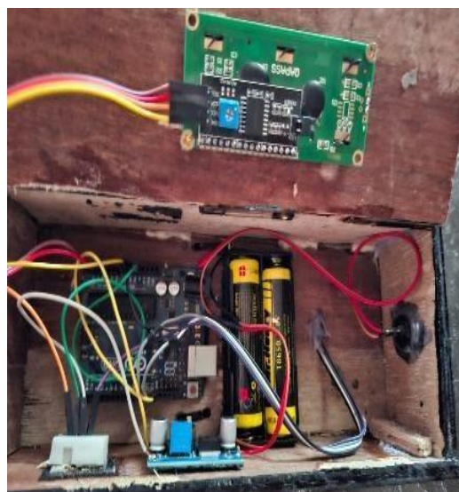
Gambar 5. Box Tempat Komponen