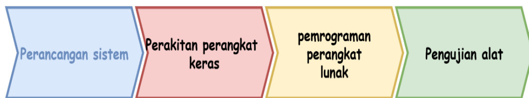
Gambar 1. Prosedur Pelaksanaan

Pada tahap implementasi, alat ukur tinggi badan otomatis digunakan dalam kegiatan pelayanan masyarakat sebagai sarana pengukuran tinggi badan yang lebih praktis dan efisien. Aparat desa dan warga diberikan penjelasan singkat mengenai cara penggunaan alat, kemudian dilakukan pengukuran secara langsung menggunakan alat yang telah dirancang.