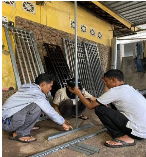
Gambar 2. Pembuatan Rangka

pemasangan komponen. Desain rangka dibuat dalam bentuk gambar kerja sebagai gambaran awal bentuk alat. Selanjutnya, desain tersebut divalidasi untuk memastikan kesesuaian dengan kebutuhan sistem. Setelah desain dinyatakan sesuai, rancangan rangka divisualisasikan dalam bentuk tiga dimensi menggunakan perangkat lunak perancangan.