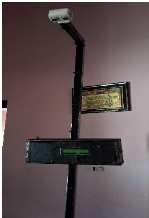
Gambar 6. Hasil Pembuatan Alat

Hasil pembuatan alat menunjukkan bahwa alat ukur tinggi badan otomatis berbasis Arduino Uno telah berhasil dirancang dan dirakit. Alat terdiri dari rangka penyangga, sensor ultrasonik, mikrokontroler Arduino Uno, serta media tampilan hasil pengukuran. Secara fisik, alat dapat berdiri dengan stabil dan seluruh komponen terpasang dengan baik sesuai dengan perancangan awal.