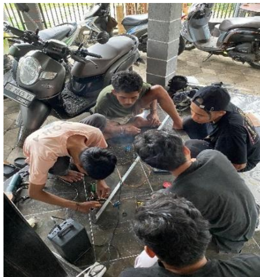
Gambar 4. Perakitan Alat

Tahap berikutnya adalah persiapan dan pemasangan komponen alat ukur tinggi badan otomatis. Komponen yang digunakan disesuaikan dengan kebutuhan sistem pengukuran, yang meliputi mikrokontroler Arduino Uno, sensor ultrasonik, media tampilan, serta komponen pendukung lainnya.