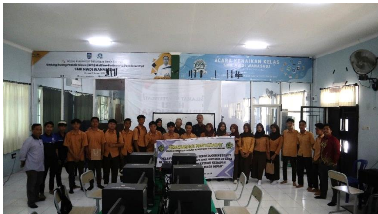
Gambar 3. Tahap akhir kegiatan pelatihan

selanjutnya. Guru pendamping juga memperoleh pengetahuan baru sehingga dapat mengintegrasikan materi ini ke dalam kegiatan ekstrakurikuler atau pengayaan kurikulum. Secara keseluruhan, hasil PKM membuktikan bahwa pengenalan dan pelatihan IoT dan robotika mampu meningkatkan literasi teknologi serta menumbuhkan motivasi inovasi siswa SMK di daerah.