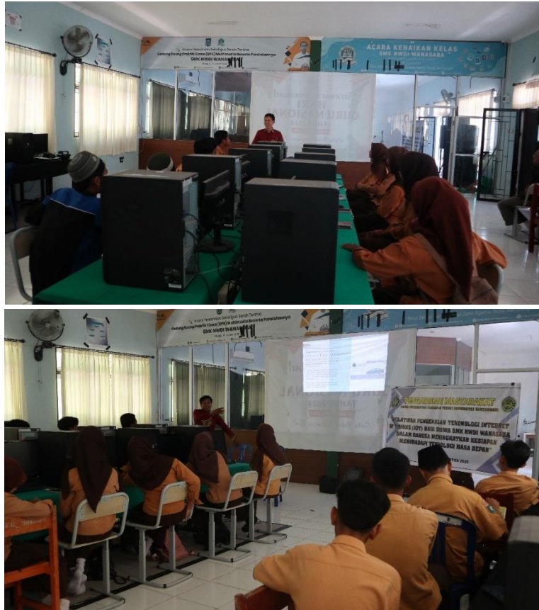
Gambar 2. Pelatihan Pengenalan Teknologi IoT dan Robotika

Pelatihan dapat meningkatkan minat siswa untuk belajar teknologi informasi utamanya pada sektor IoT dan Robotika.