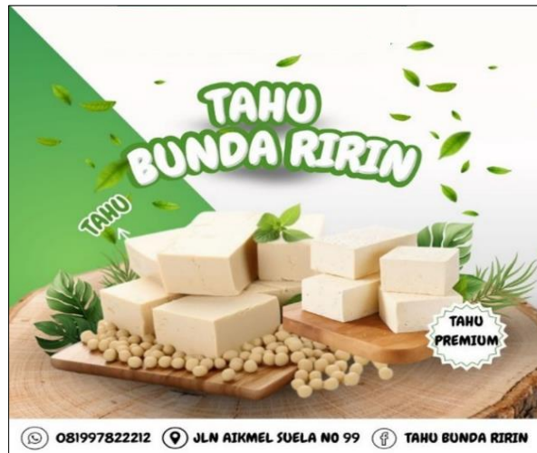
Gambar 3. Hasil Desain Banner UMKM Tahu Bunda Ririn