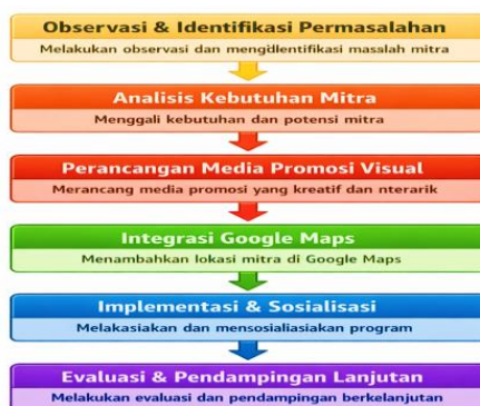
Gambar 1. Tahapan Pelaksanaan Pengabdian

Pelaksanaan kegiatan pengabdian dilakukan melalui beberapa tahapan yang tersusun secara sistematis untuk memastikan solusi yang diberikan sesuai dengan kebutuhan mitra. Adapun Roadmap atau peta jalan tahapan pengabdian yang dilakukan berdasarkan bidang yang diteliti sebagai berikut :