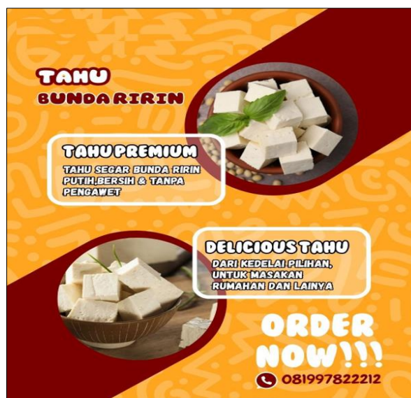
Gambar 4. Hasil Desain Poster Promosi UMKM Tahu Bunda Ririn

Selain banner, dibuat pula poster promosi yang menampilkan produk unggulan UMKM dengan desain visual yang menarik dan informatif. Poster digunakan sebagai media promosi tambahan yang dapat dipasang di area publik maupun dibagikan melalui media sosial. Pemanfaatan poster membantu memperkenalkan produk kepada masyarakat secara lebih luas sekaligus memperkuat identitas visual UMKM.