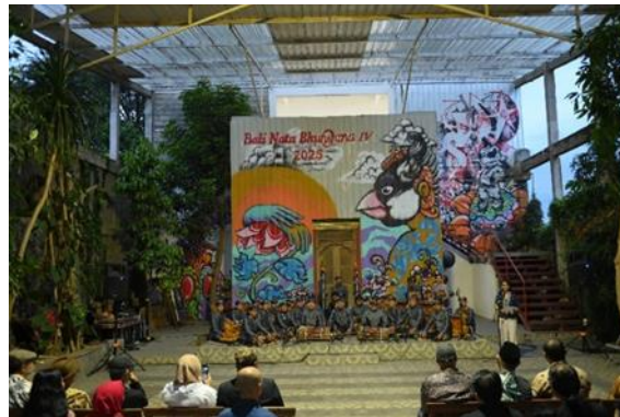
Gambar 2. Konfigurasi ansambel Gong Kebyar yang digunakan dalam pertunjukan di Art of Space Sangkring Yogyakarta

modernisasi gamelan Bali, karena mampu menyesuaikan diri dengan kebutuhan pertunjukan baru, termasuk tari kreasi (Bandem, 2013). Selain itu, penambahan instrumen tradisional seperti kendang, ceng-ceng, rebab, dan suling dikolaborasikan untuk memperkaya warna bunyi ansambel, menambah kompleksitas ritmik, serta menonjolkan nuansa musikal yang beragam sehingga iringan musik menjadi lebih hidup dan responsif terhadap pergerakan penari.