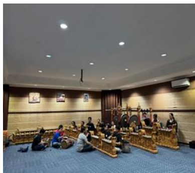
Gambar 1. Proses sinkronisasi antara komposer dan penari pada tahap ngawangun

Dalam praktik penciptaan iringan Tari Kirana Rasmi, digunakan berbagai teknik musikal khas karawitan Bali yang memperkaya dimensi artistik dan ekspresif karya tersebut, antara lain teknik Polifoni Kotekan yang melibatkan perpaduan rumit antara pola nyangsih dan nyogcag yang saling melengkapi untuk menciptakan tekstur ritmik yang padat dan dinamis, seperti yang dijelaskan oleh Tenzer (Tenzer, 2000). Selain itu, penerapan teknik Dinamika Dramatik sangat krusial dengan pengaturan tempo, volume, serta aksentuasi secara terperinci yang bertujuan untuk mendukung serta mempertegas perubahan suasana dan emosi dalam setiap fase tari. Teknik Transposisi Laras juga dimanfaatkan sebagai strategi musikal dengan melakukan pergantian antara laras slendro dan pelog untuk membedakan karakteristik atau adegan tertentu dalam tari, sehingga memberikan variasi dan nuansa yang berbeda sesuai kebutuhan naratif. Tak kalah penting, teknik Timbre Eksperimental turut diaplikasikan melalui eksplorasi warna suara yang lebih inovatif, yakni dengan menggabungkan instrumen tradisional gamelan dengan unsur bunyi alam atau media digital sesuai dengan arah estetika karya yang diinginkan, sebagaimana diuraikan oleh Sukerta (Sukerta, 2003). Kombinasi teknik-teknik ini tidak hanya memperkaya aspek musikal, tetapi juga memperkuat hubungan interaktif antara musik dan tari, menciptakan pengalaman artistik yang holistik dan mengesankan bagi penonton pertunjukan Tari Kirana Rasmi.