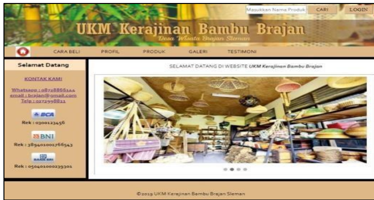
Gambar 2. User Interface Menu Utama