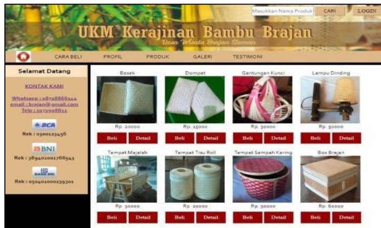
Gambar 3. User Interface Produk