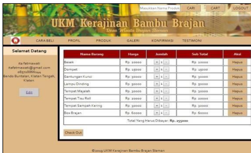
Gambar 4. User Interface Keranjang

Saat pelanggan melakukan klik beli pada produk tertentu, produk tersebut secara otomatis akan masuk kedalam cart /keranjang. Pada halaman ini pelanggan dapat menghapus, menambah dan mengurangi jumlah produk yang akan dibeli. Apabila pelanggan ingin membaca testimoni dari para pembeli dapat langsung klik menu testimoni, maka akan muncul tampilan testimoni dari anggota seperti pada gambar. 5, Anggota dapat menambahkan testimoni produk yang sudah dibeli dengan cara klik button tambah untuk menambahkan testimoni.