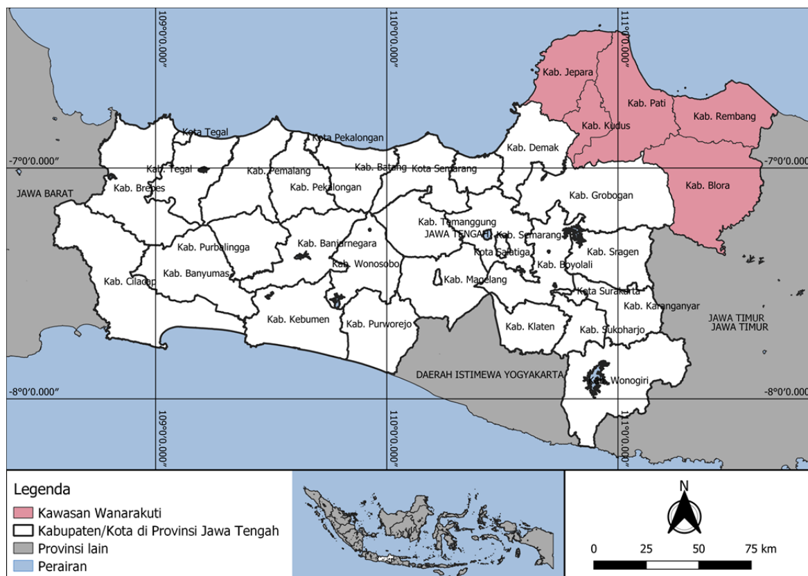
Gambar 1. Peta Lokasi Penelitian (Kawasan Wanarakuti)

Ruang lingkup wilayah dalam penelitian ini adalah Kawasan Wanarakuti, salah satu kawasan andalan di Provinsi Jawa Tengah menurut RTRWN Tahun 2008/2017, yang terdiri dari 5 kabupaten, yaitu Kabupaten Jepara, Kudus, Pati, Rembang, dan Blora. Secara lebih jelas, ruang lingkup wilayah dalam penelitian ini bisa dilihat pada gambar berikut.