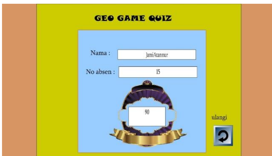
Gambar 3. Tampilan akhir media kuis

Pada tampilan soal berisi soal kuis mengenai materi permasalahan penduduk dan terdapat kolom poin, hasil dan waktu. Kuis yang diberikan berupa soal-soal berupa pilihan ganda yang akan dijawab oleh siswa melalui android masing-masing. Pada tahap ini peserta didik dilatih untuk fokus dan membaca soal secara cepat dan tepat karena setiap soal akan diberi waktu 30 detik untuk siswa memikirkan jawaban. Siswa yang tepat dalam menjawab soal, maka akan mendapatkan poin 1. Jika salah dalam menjawab soal, maka tidak akan mendapatkan poin. Apabila siswa telah selesai menjawab kuis, selanjutnya mengklik tombol next untuk lanjut ke nomor berikutnya. Pengisian soal kuis akan berlanjut hingga nomor 20. Tampilan selanjutnya yaitu tampilan akhir dapat dilihat pada gambar 3 dibawah ini.