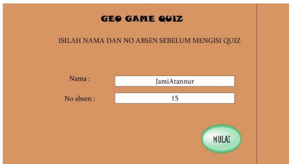
Gambar 1. Tampilan utama pada media kuis Adobe Flash CS6

Pada tampilan awal media kuis terdapat halaman utama terdapat kolom untuk mengisi nama dan nomor absen. Tampilan awal media kuis dapat dilihat pada Gambar 1 .